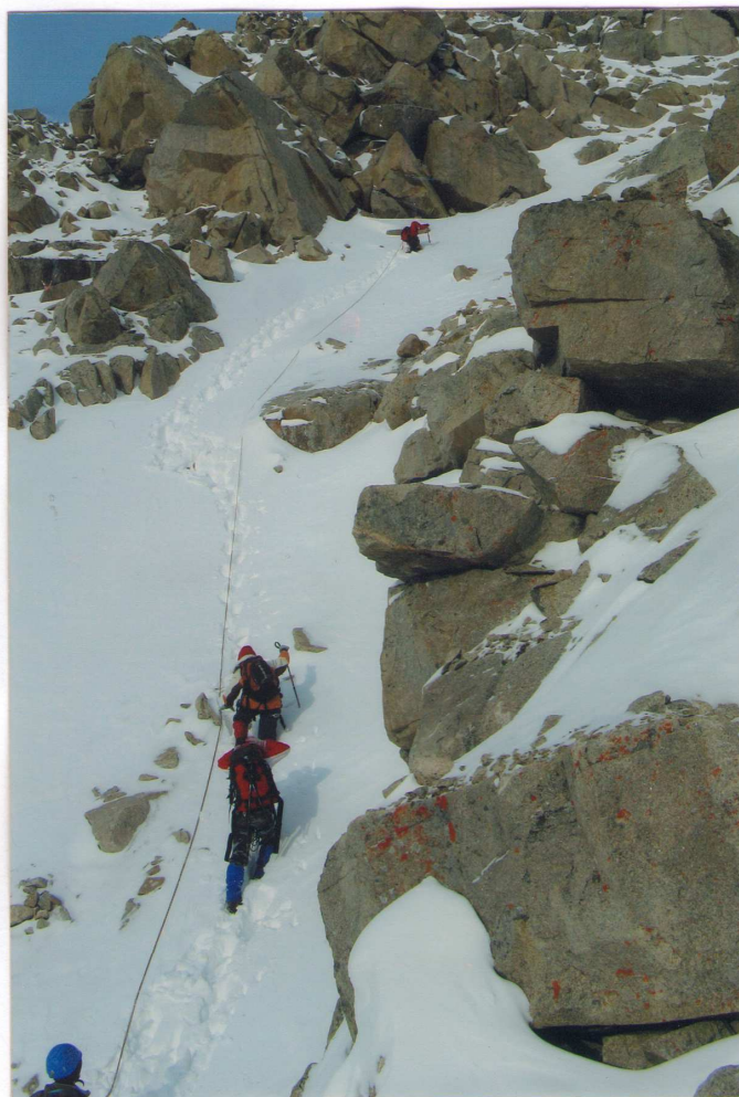
Фото 3 На участке R5-R6