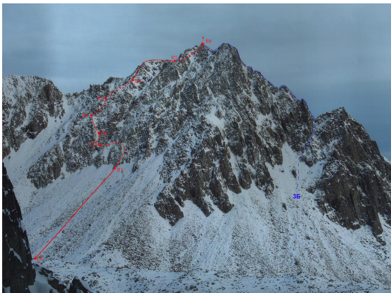
Пик Баруун 2874 м. Снято с пика Монах