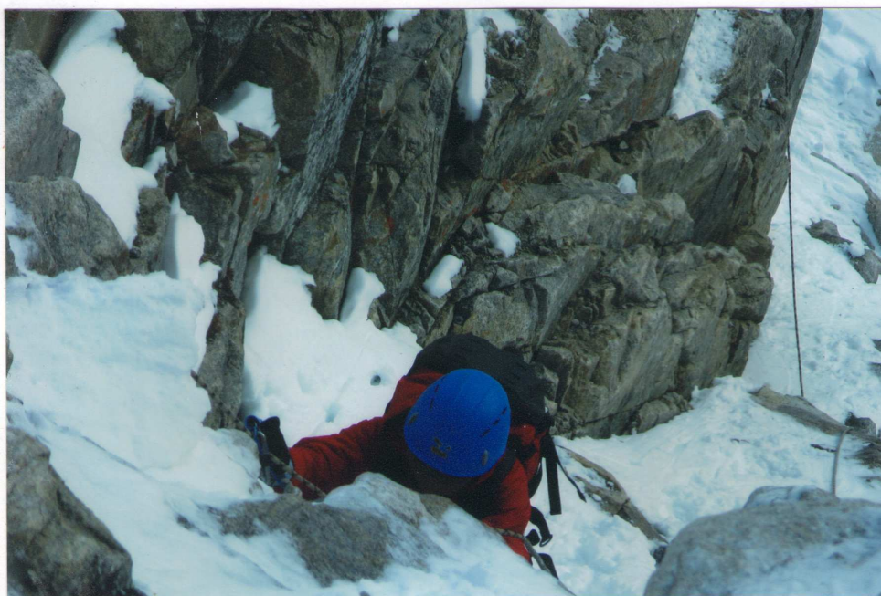
Фото 2 На участке R2-R3