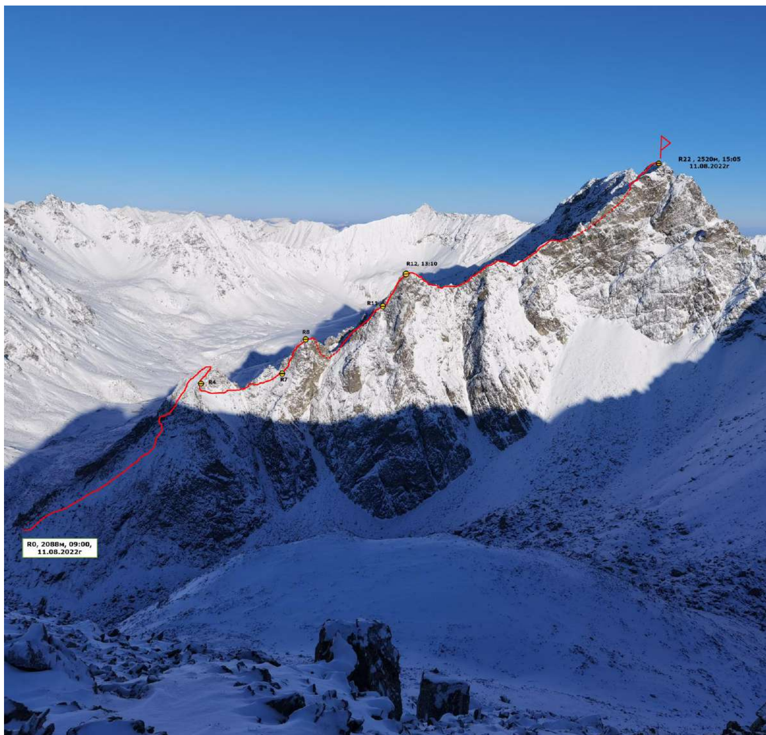
Фото выполнено с вершины Страж 2486м, удаление 1500м.