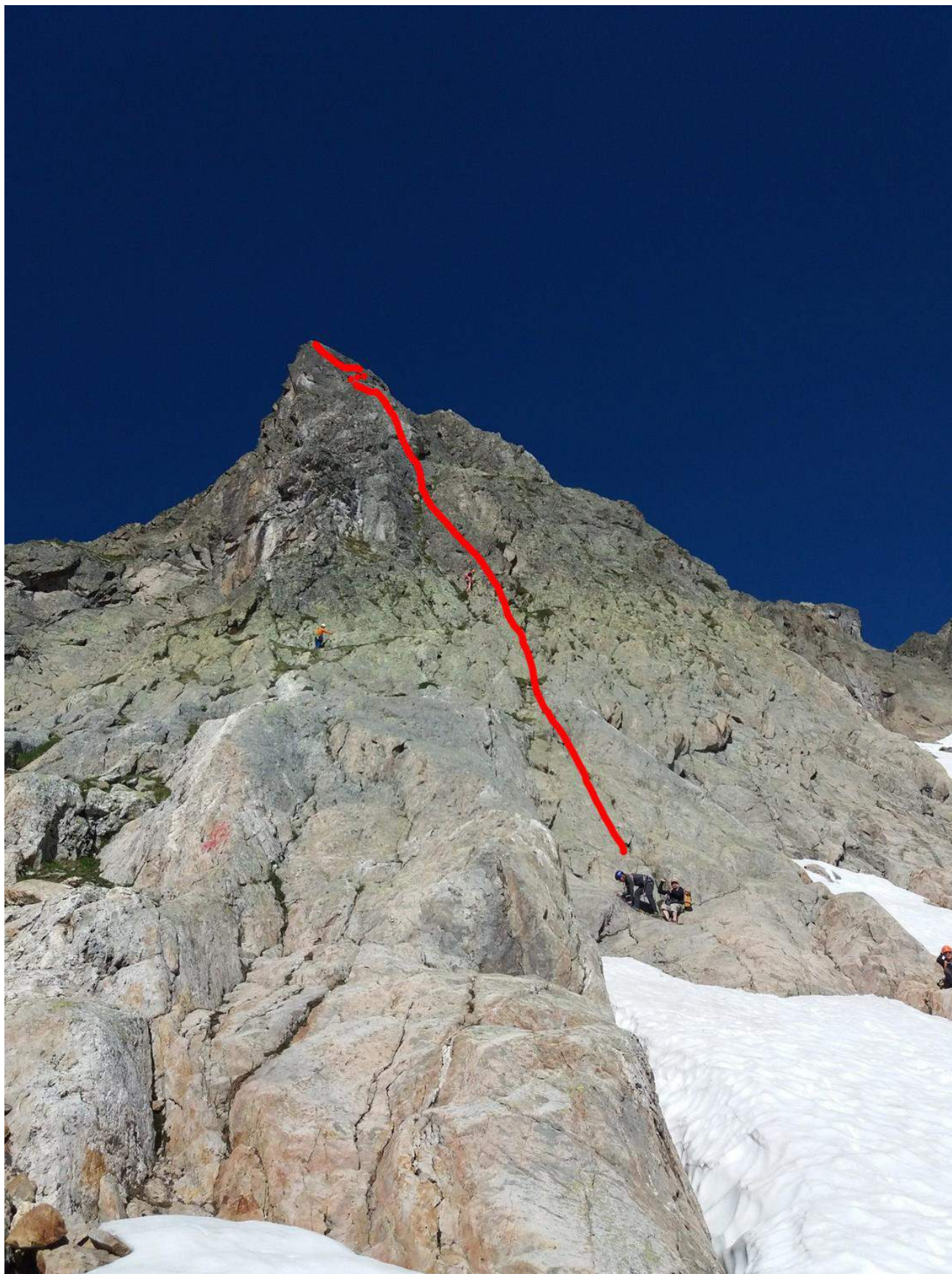
Фото 1. Маршрут снизу.