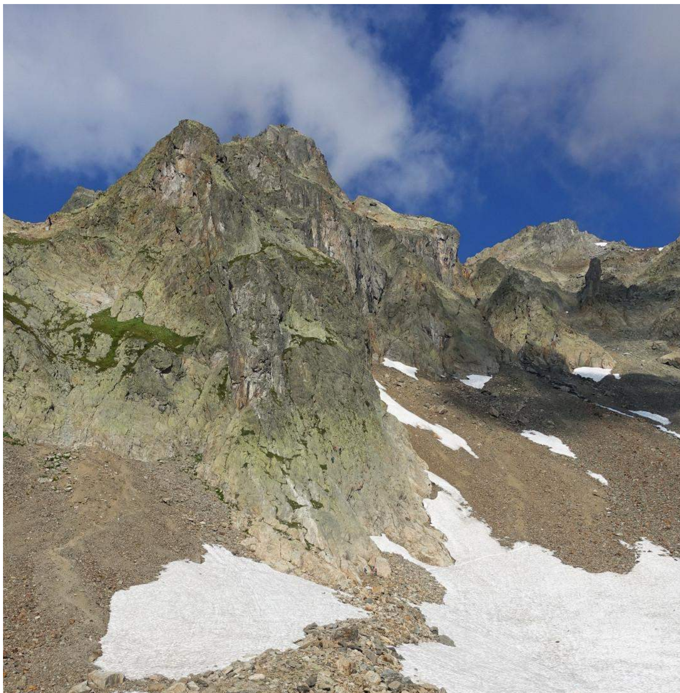
Фото вершины Эгю де ла Глер (Aiguille de la Glière), фото сделано возле кресельного подъемника Индекс (Télésiège de l'Index).