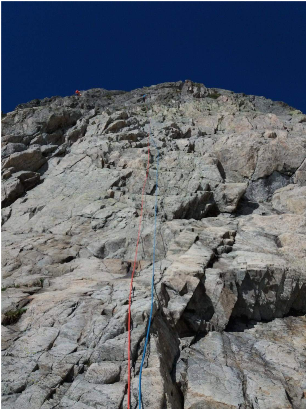
Фото 2. Вид на участок R2-R3.