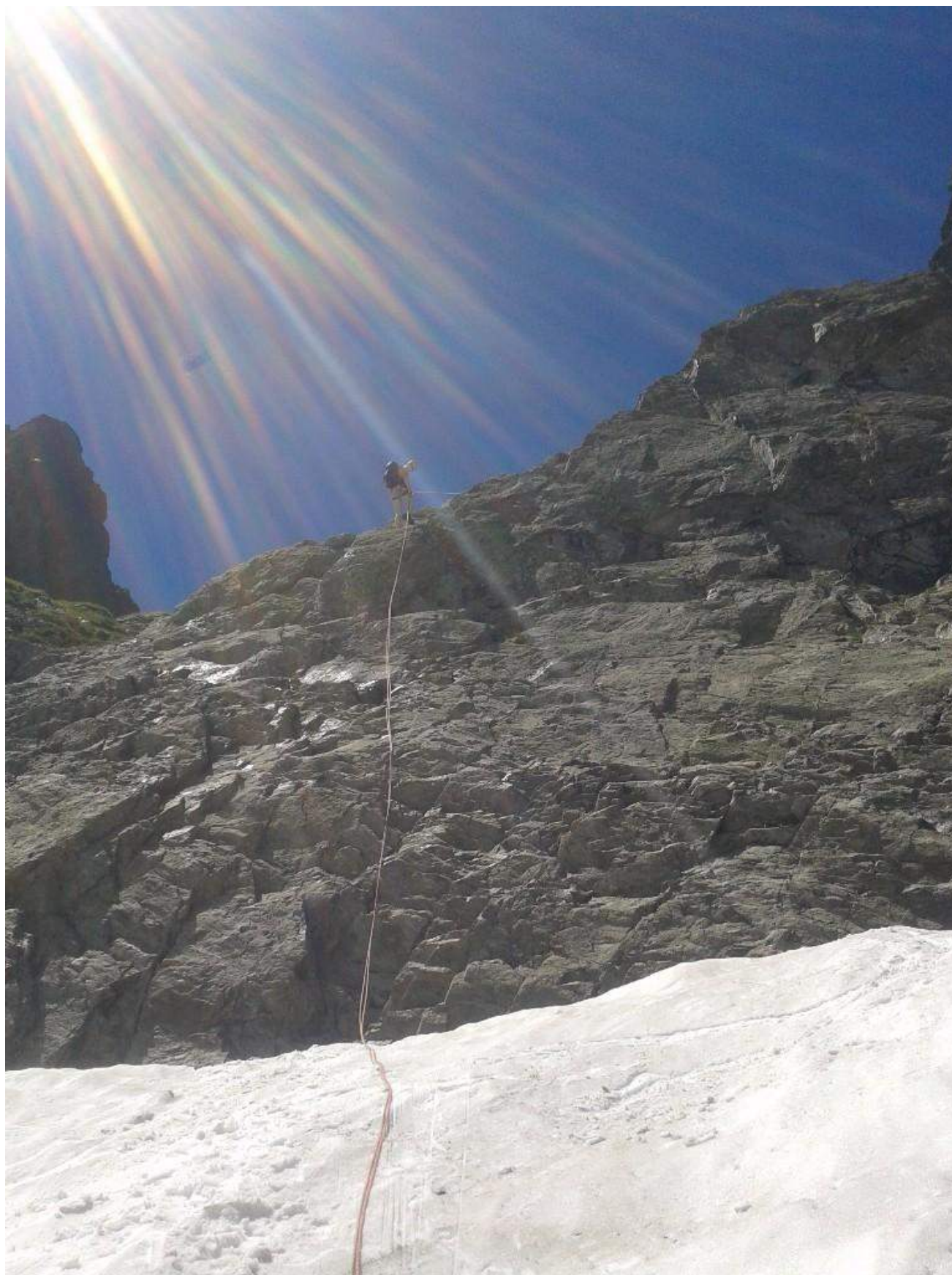
Фото 5. Дюльфер