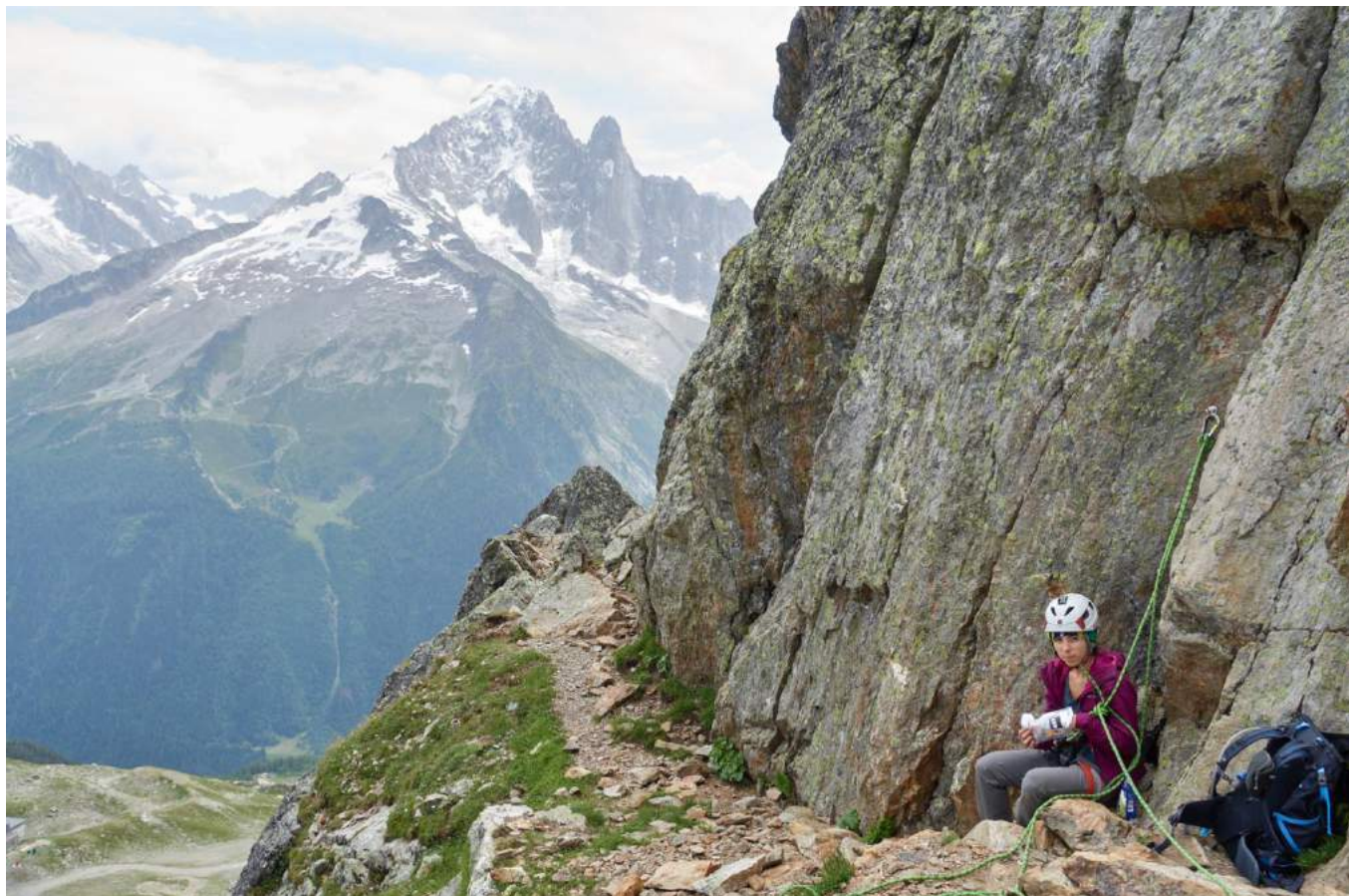
Фото 3. На станции перед ключевой веревкой.