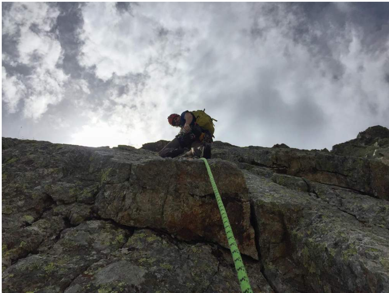
Фото 4. Участок R4-R5. «Ключ» маршрута.