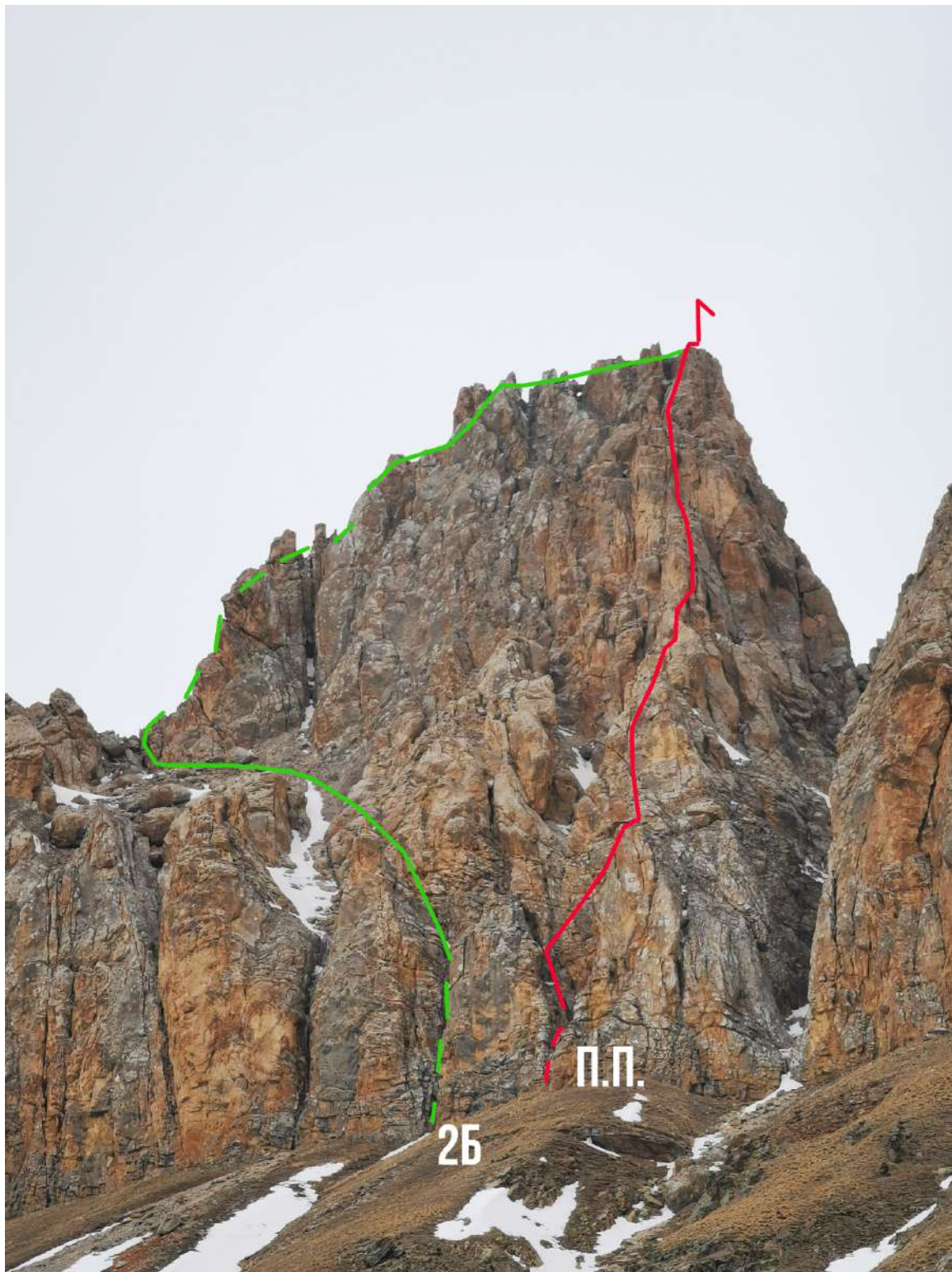
Общее фото вершины Мещена центральная 3150 на подходе 18.04.2022г.