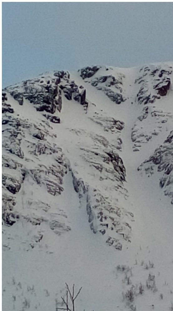
Рис. 4. Вид на маршрут от точки начала маршрута