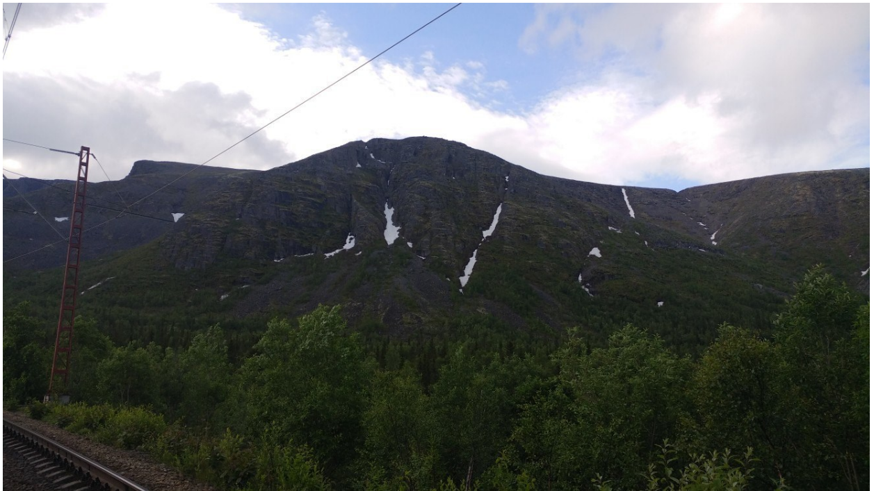
Рис. 3. Вид на маршрут от ЖД путей