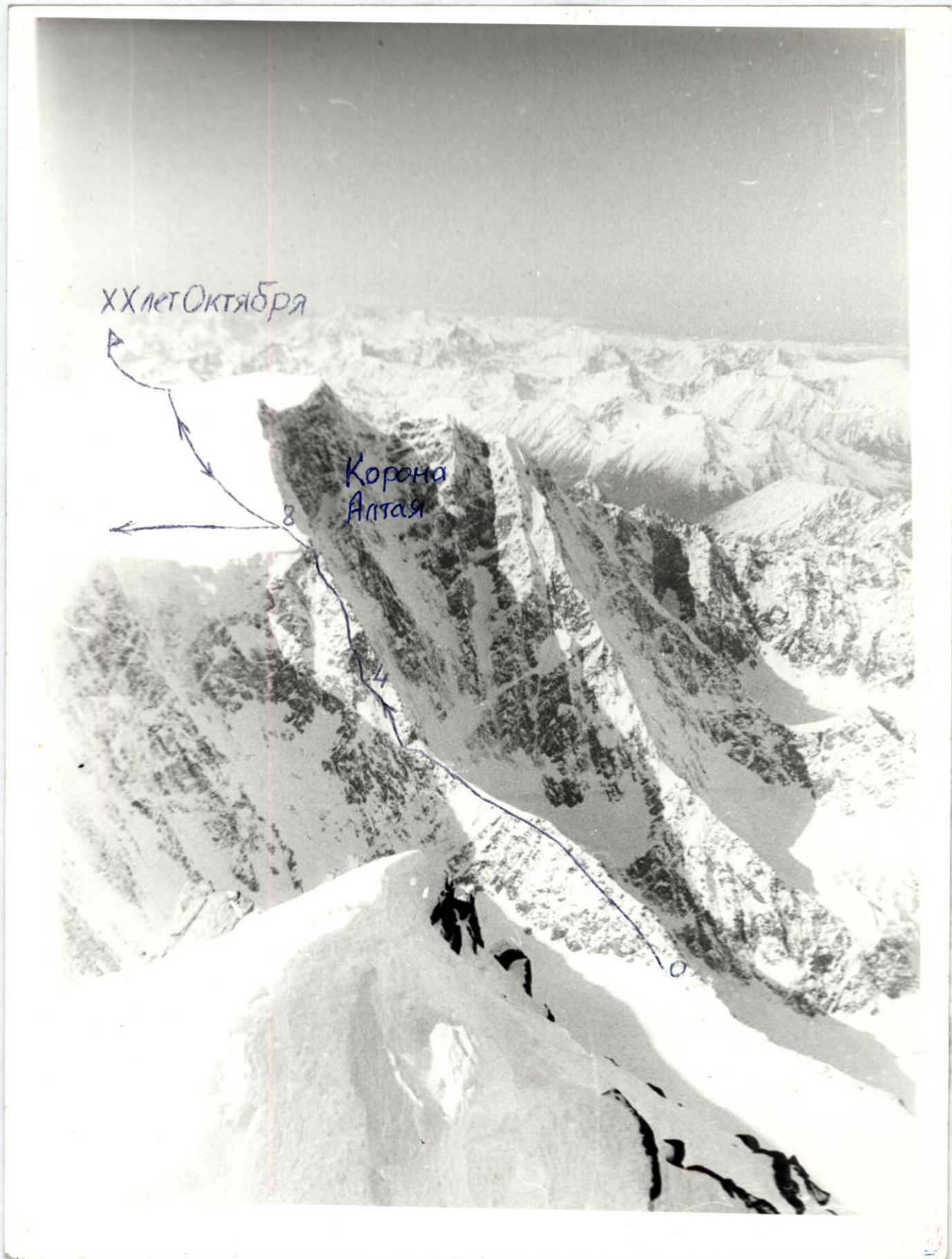
Снято с Белухи Вост. Ф/а "Смена-8м" 3 октября 1983г.