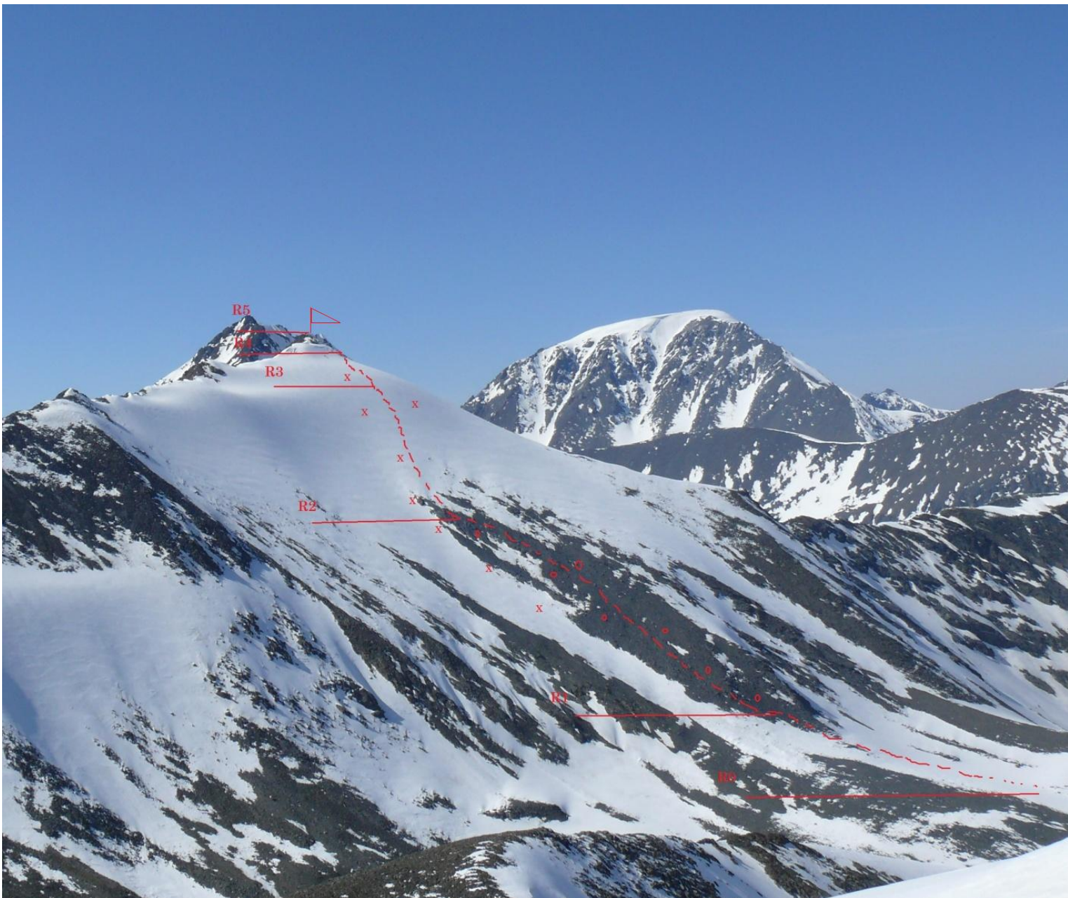
Фото профиля маршрута слева