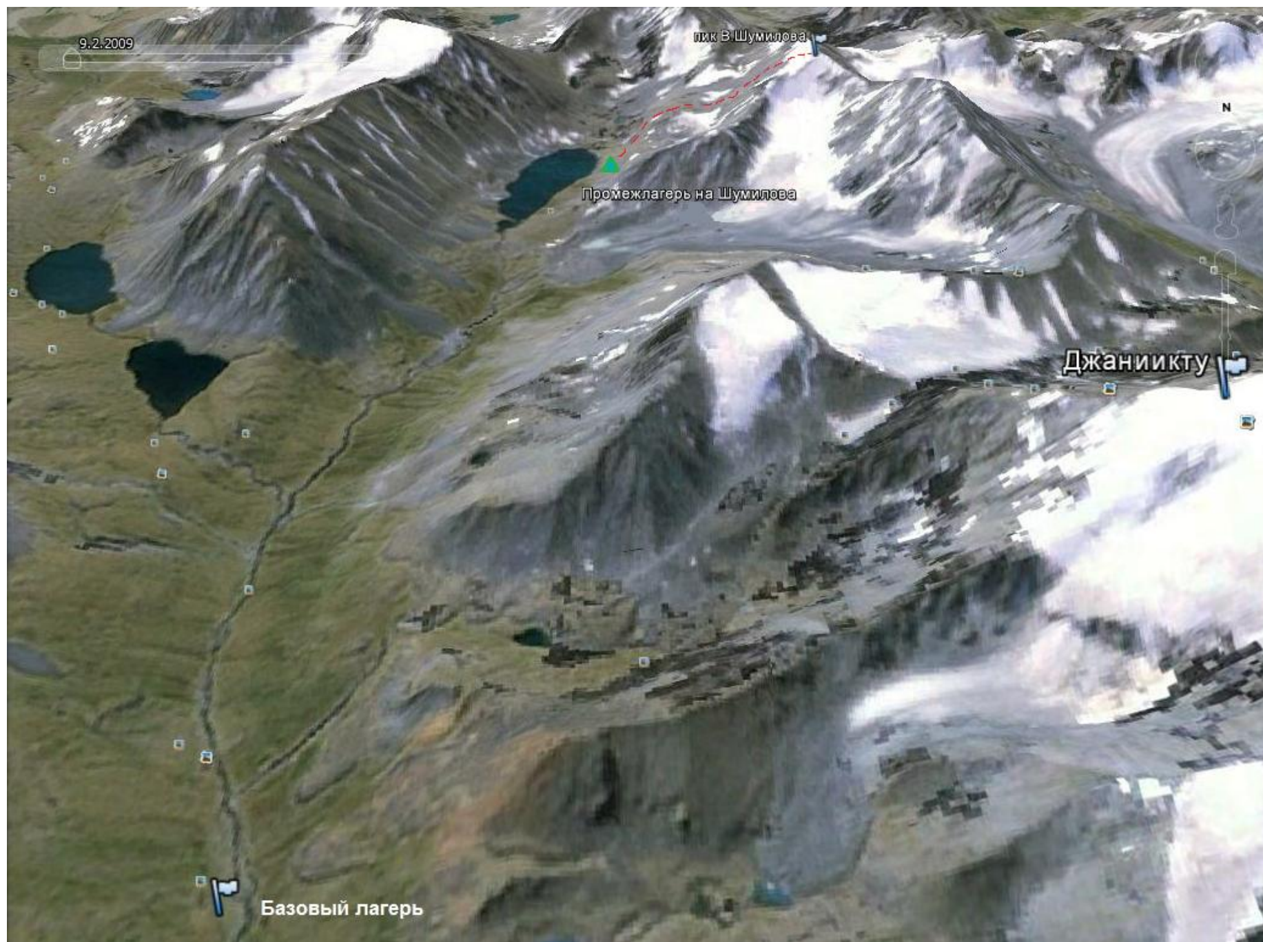
Маршрут на п. В.Шумилова по центру Восточного склона, картосхема 2, вид с севера