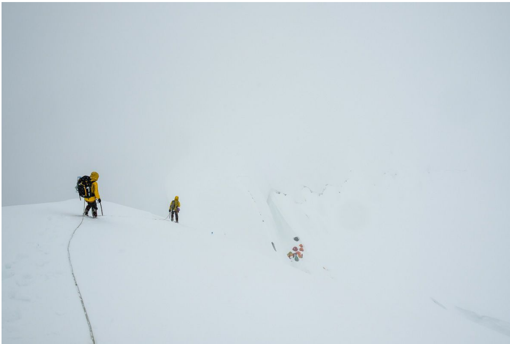
Спуск с пика Чапаева на перемычку. Виден лагерь с Юга, но нам не туда, нам выше и чуть дальше, левее по ходу движения. Внимательно: в плохую погоду можно уйти на сбросы в южную сторону.