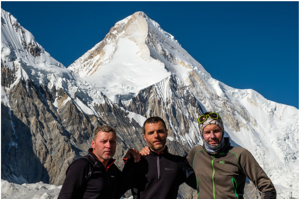
Команда после спуска, вид с Юга

Красивый, логичный, интересный и не самый простой маршрут на вершину. Скорее соответствует 5Б кат. сложности, но в связи с наличием стационарных перил, адекватно сложность оценить затруднительно. Субъективно кажется, интереснее и безопаснее маршрута с Юга.