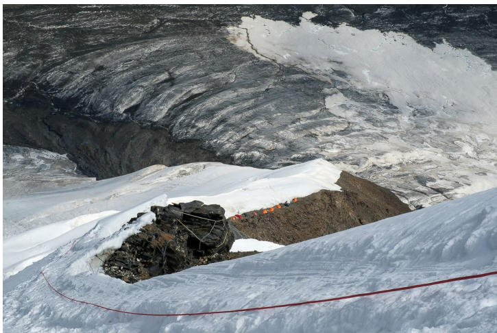
Подъем во 2й лагерь и вид на 1й лагерь сверху

Выход из БЛ (4 000 м) во 2й лагерь, минуя 1й лагерь, на 5 500 м. Тяжелый и длинный переход. Практически все время подъем на передних зубьях кошек. Встречаются вертикальные участки, скальные жандармы, ледовые стенки. Средняя крутизна 45 гр. Ориентирование не сложное: все время движешься по ребру и по перилам. Перила – леска и иногда старые статические веревки. Вечером начинается метель. Холодно.