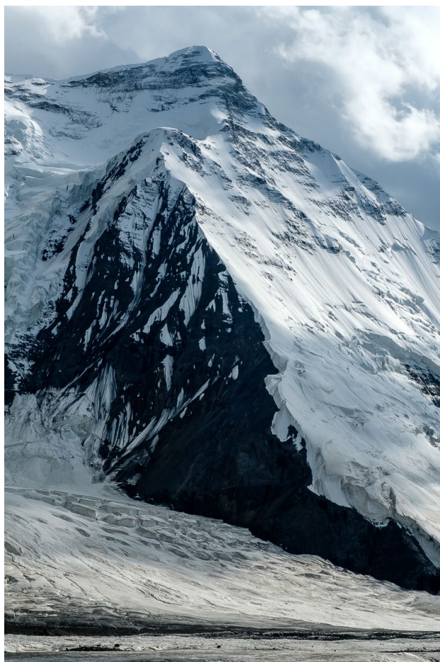
СВ ребро и пик Чапаева

У команды было 3 лагеря: 1 лагерь (4600), 2 лагерь (5500), 3 лагерь – седло (5850)