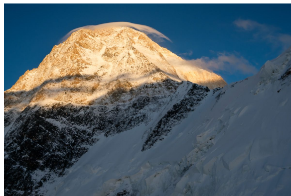
Верхняя часть маршрута