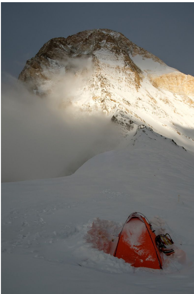
Вид на ребро с 5800-5900 с перемычки