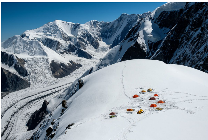
2й лагерь, снято во время акклиматизации