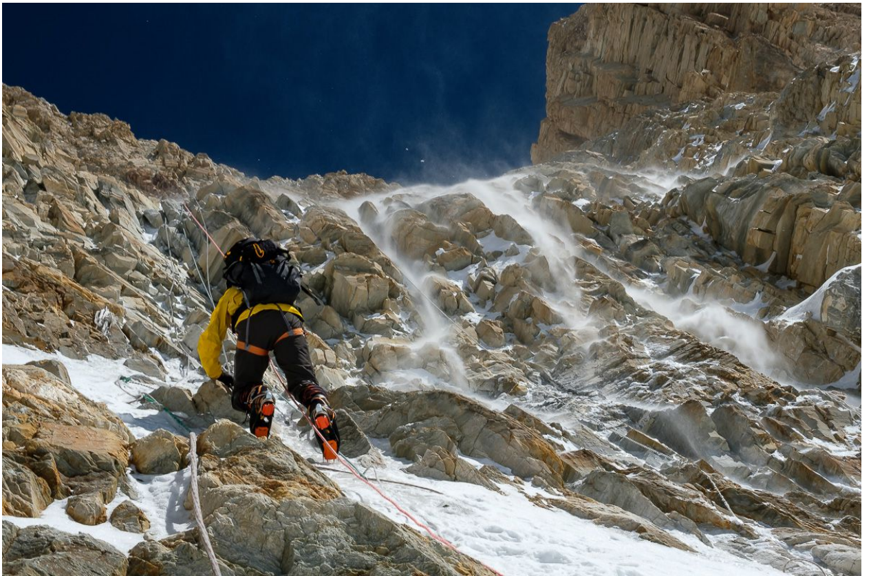
Восхождение на вершину, скальная стенка перед снежным кулуаром