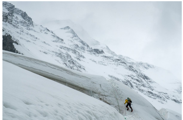
Подъем в 1й лагерь