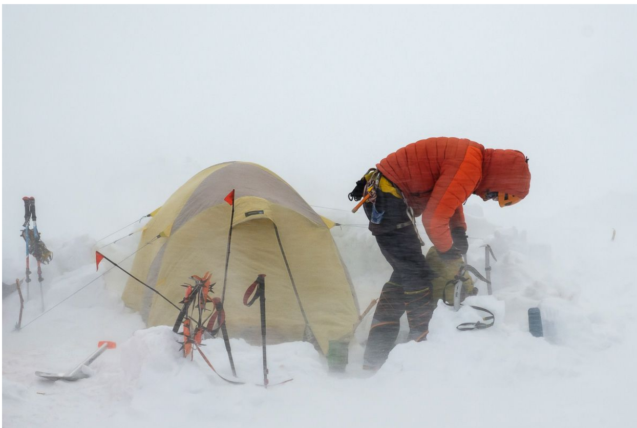
3й лагерь на 5850