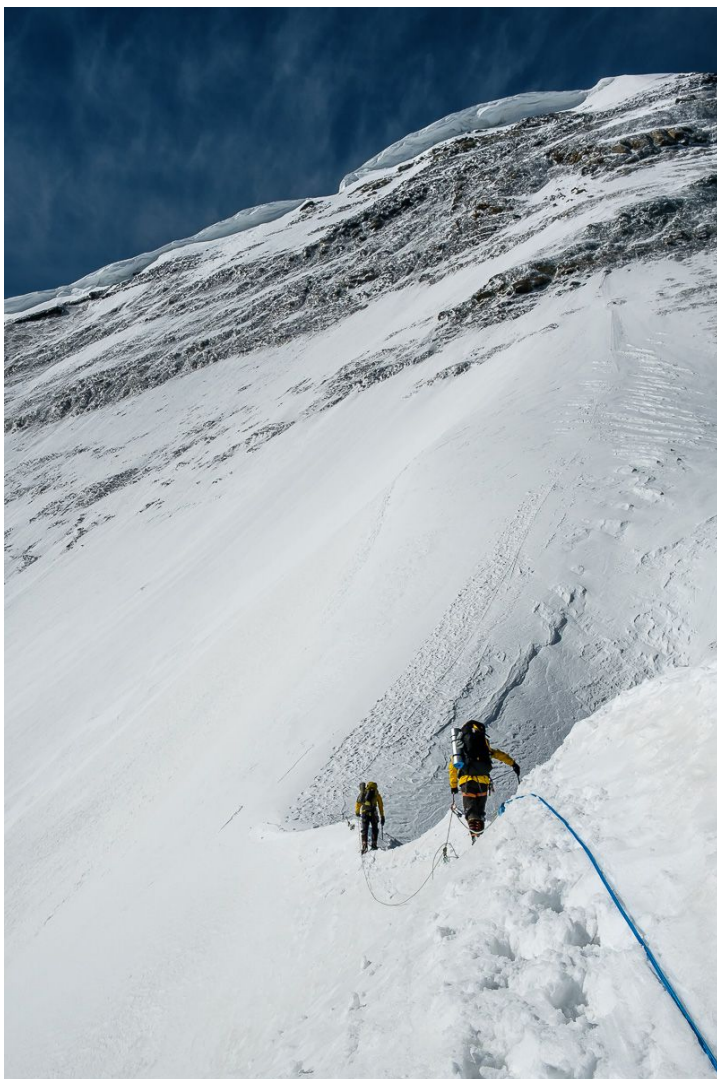
Начало подъема в 3й лагерь, под пиком Чапаева

Подъем на пик Чапаева и спуск направо на перемычку Хан-Тенги. В средней части подъема крутизна скал со льдом достигает 60-70 гр. Участки по 10-20 м. Перила старые, потрепанные, нужно быть внимательным при выборе веревки. После подъема на пик Чапаева (6100-6200 м) перила заканчиваются и начинается закрытый ледник. Нужна веревка для передвижения по закрытому леднику. Ниже, склон прорезает ступенью большой берг, с перилами и лестницей. Движемся в метель и в полное отсутствие видимости. Вечером встаем на ночевку на перемычке (5 800 – 5900 м), вырывая глубокую яму и устанавливая туда палатку. Сильный ветер.