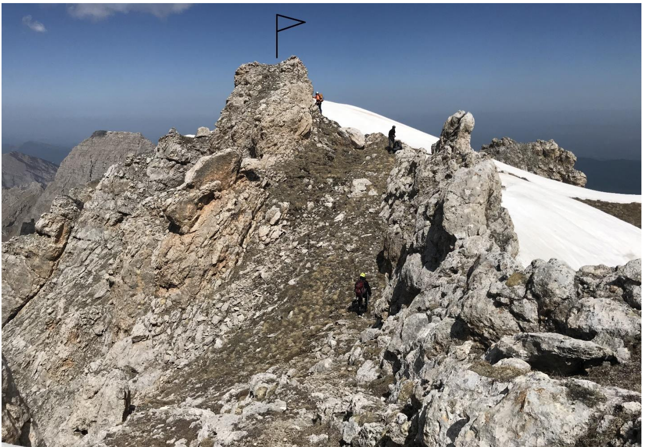
Фото 6. Вершина.