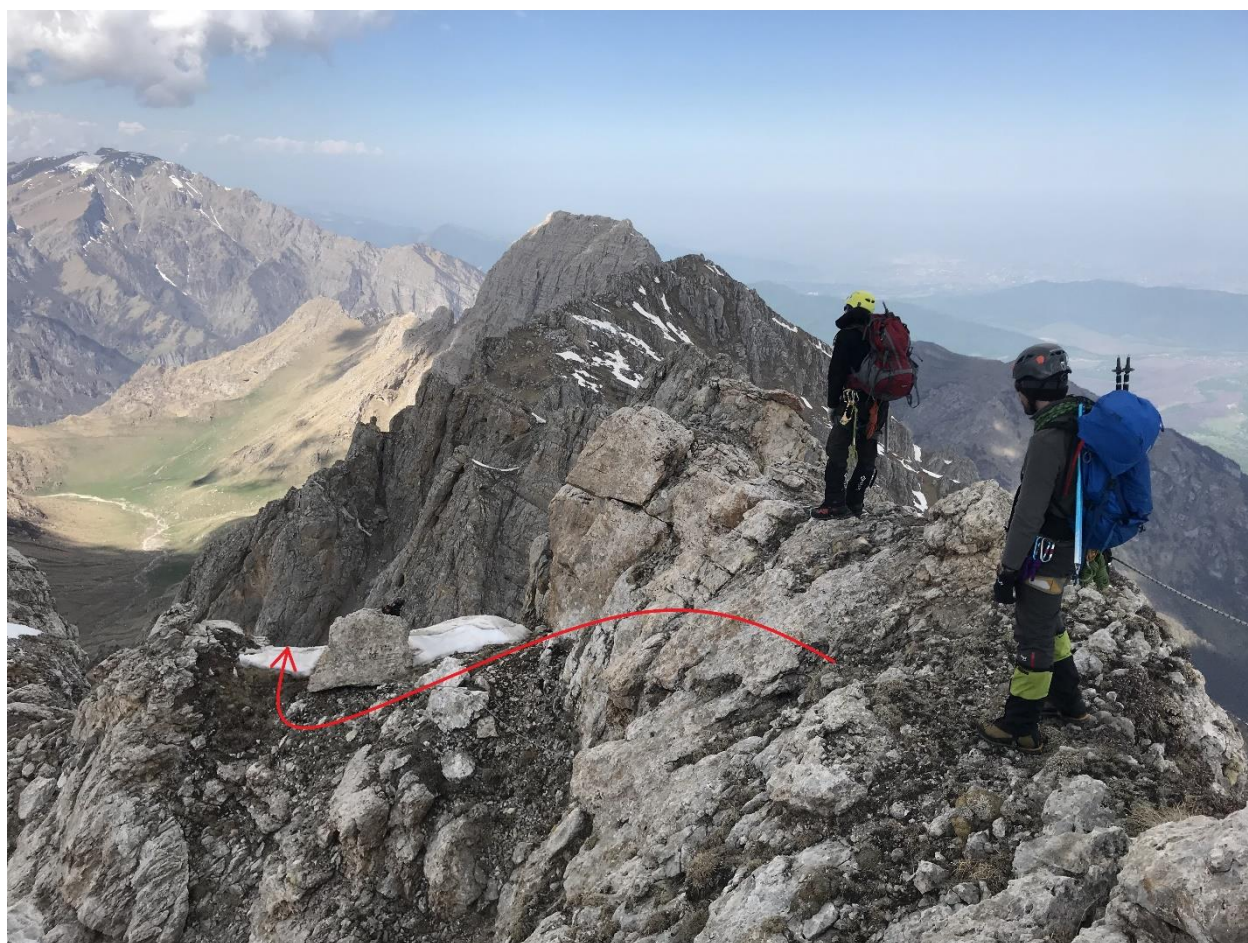
Фото 8. Спуск к провалу в гребне.