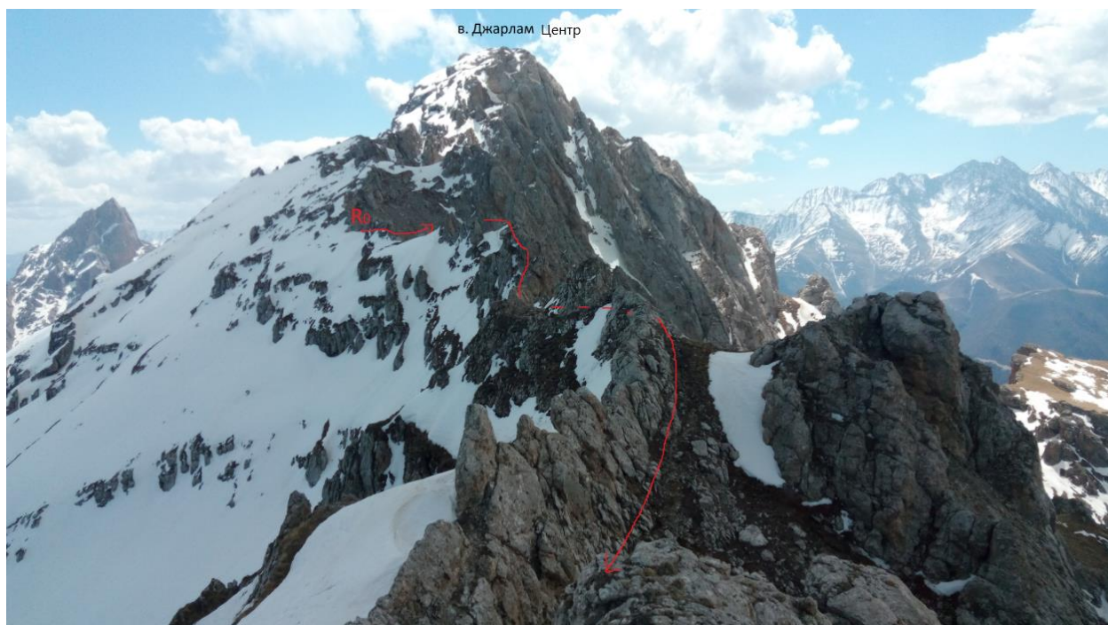
Фото 7. Вид с вершины на маршрут.