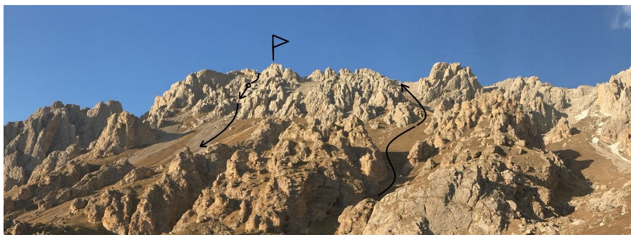
Фото 3. Подход и спуск.