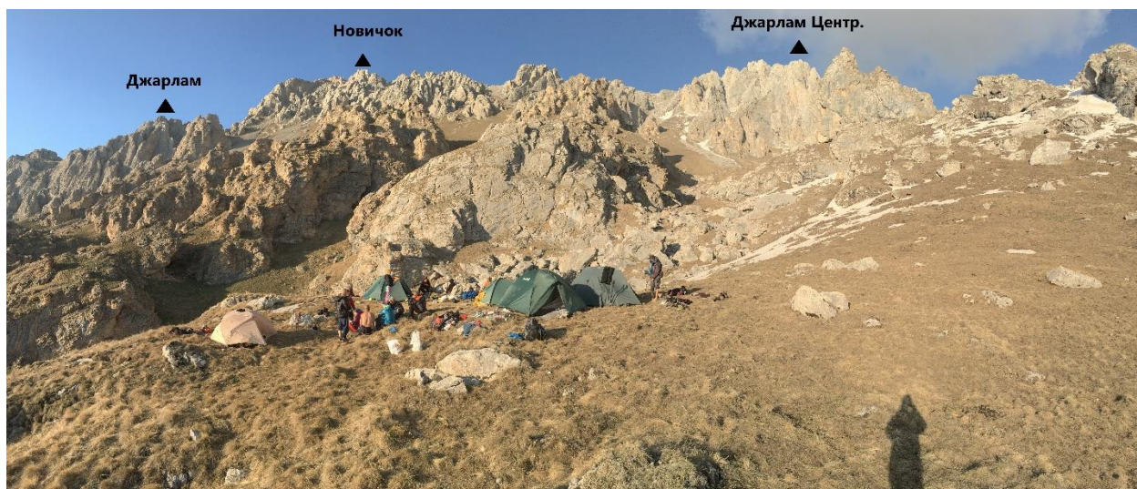
Фото 2. Панорама гребня и лагерь на перевале Джарлам.