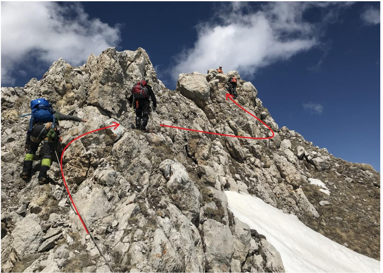
Фото 5. Взлет гребня.