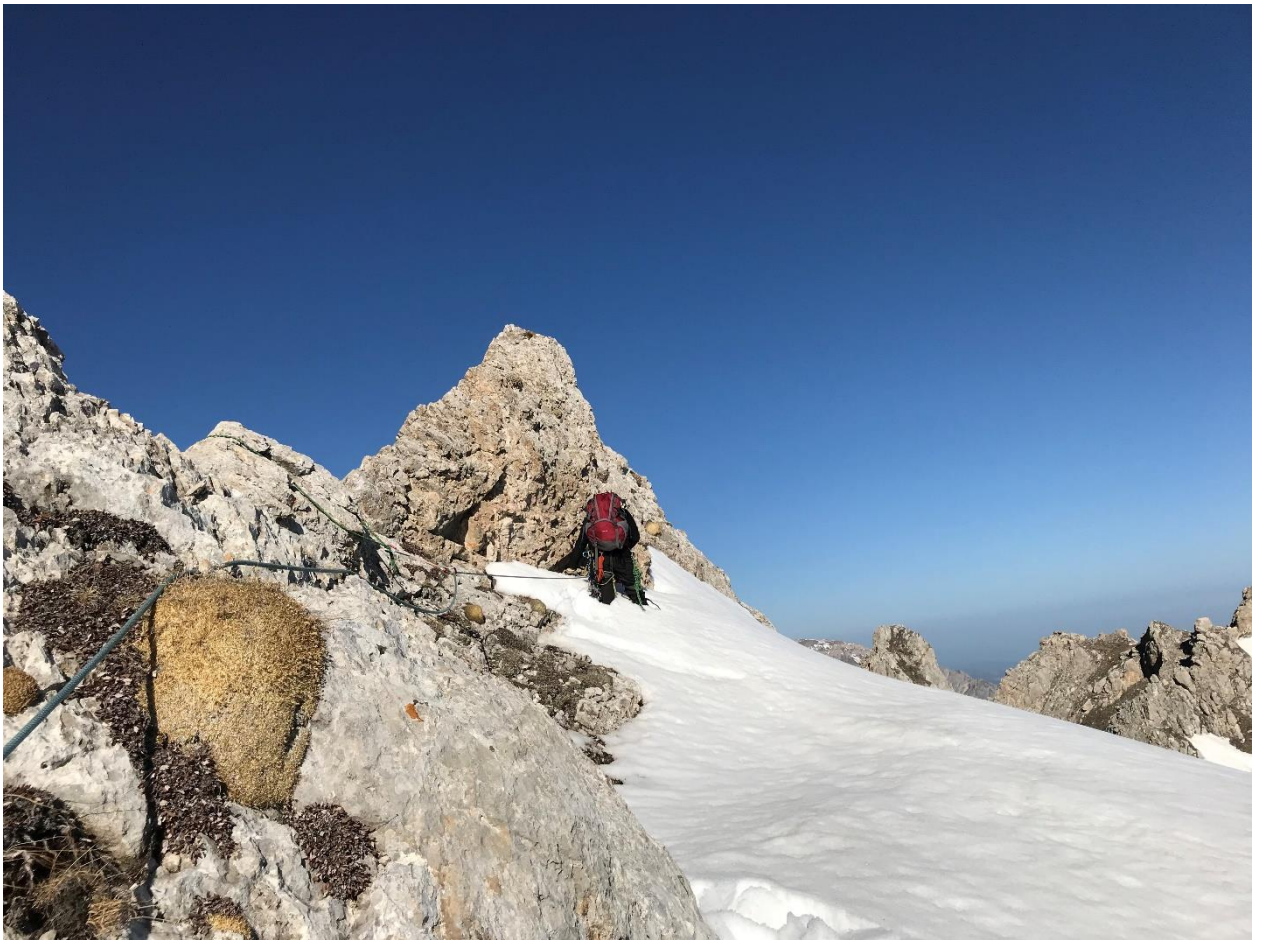
Фото 4. Начало маршрута.

Через 160 метров провал в гребне, дюльфер (10 метров). Место для дюльфера удобное. После дюльфера подъем на разрушенный жандарм. С жандарма лазанием вниз в небольшой провал в гребне. Страховка, камнеопасно! Далее движение по гребню одновременно, страхуясь за выступы, до взлета гребня, который преодолевается по полке с правой стороны и затем по внутреннему углу, выводящему вверх на гребень. Для страховки было использовано 2 закладных элемента. Далее по простому гребню до вершины Новичок. От дюльфера до вершины 250 метров. На вершине тур.