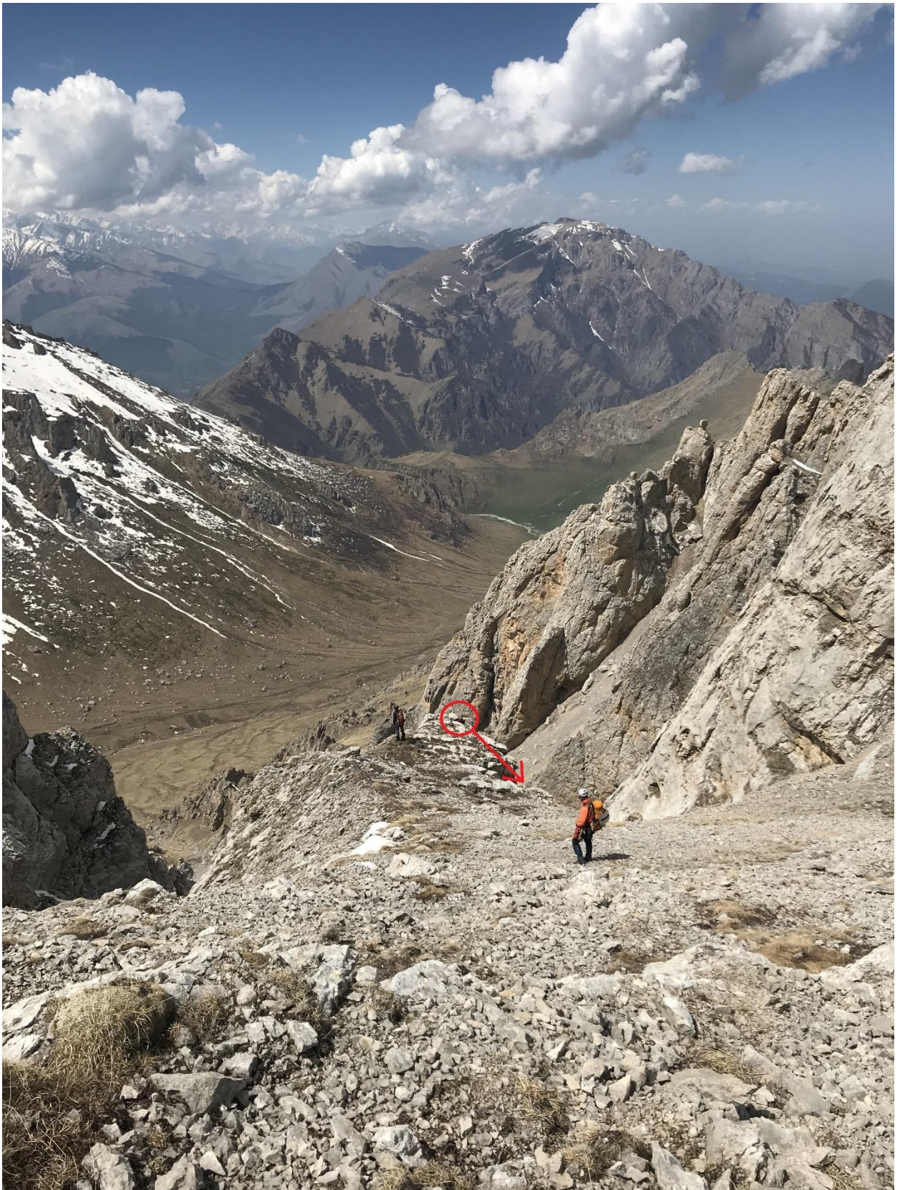
Фото 9. Дюльфер на спуске.