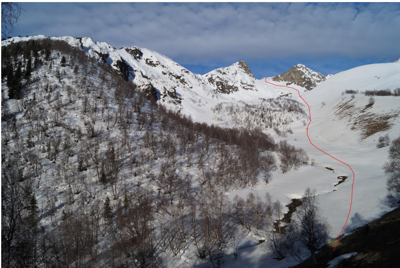
Рис.7. Подход к маршруту по правому притоку р.Габулу-Чат