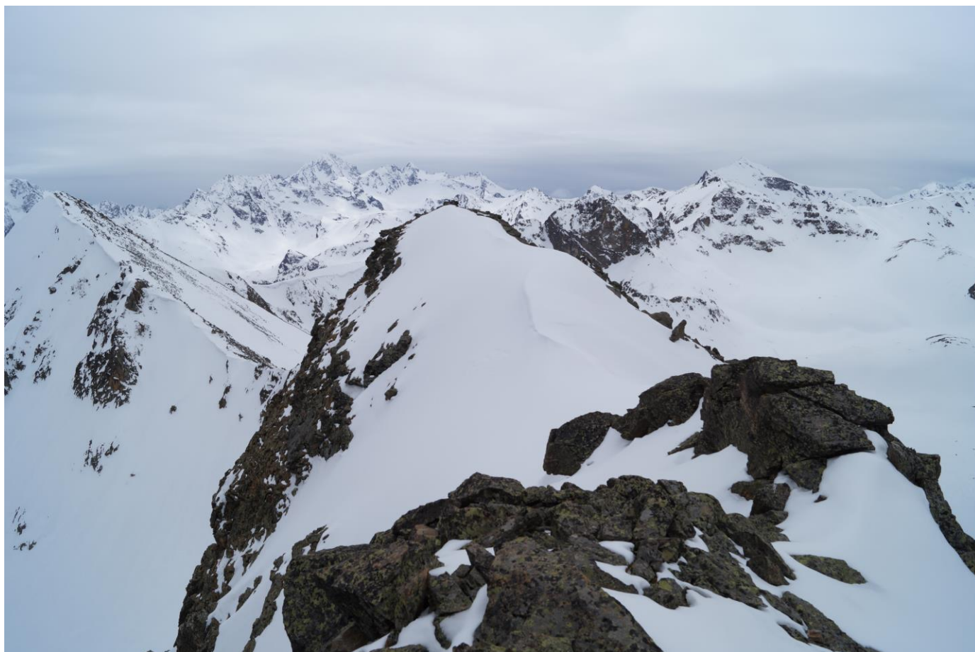
Рис.13. Вид с вершины на «геодезическую вершину»