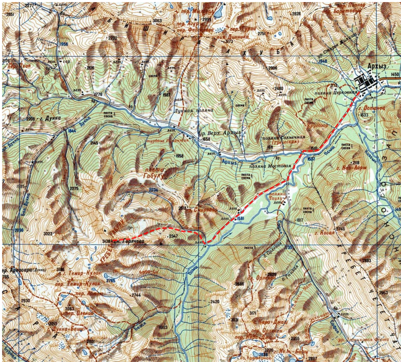
Рис.4. Обзорная карта района

Путь к месту штурмового лагеря: от посёлка Архыз на автотранспорте по асфальтированной дороге до моста через р. Архыз – 4км, далее по грунтовой дороге (рекомендуется автотранспорт повышенной проходимости) до ручья Габулу-Чат – 6,5 км. У места пересечения дорогой ручья Габулу-Чат возможно организовать полноценный лагерь (ночёвку).