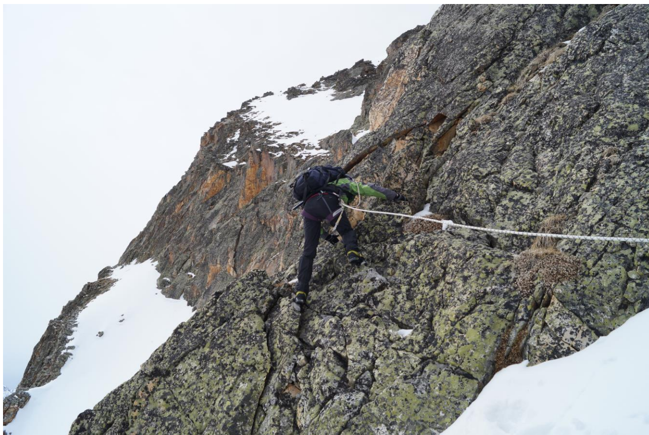
Рис.11. Участок R_2 - R_3