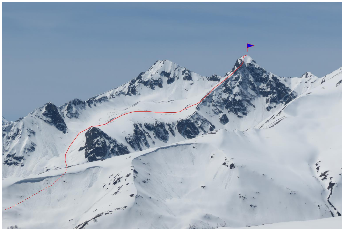
Рис.2 Вид на скалу Горячева с севера (со склонов хребта Абишира Ахуба). 3.05.2015г