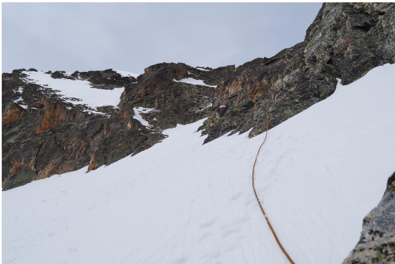
Рис.10. Участок R_1 - R_2