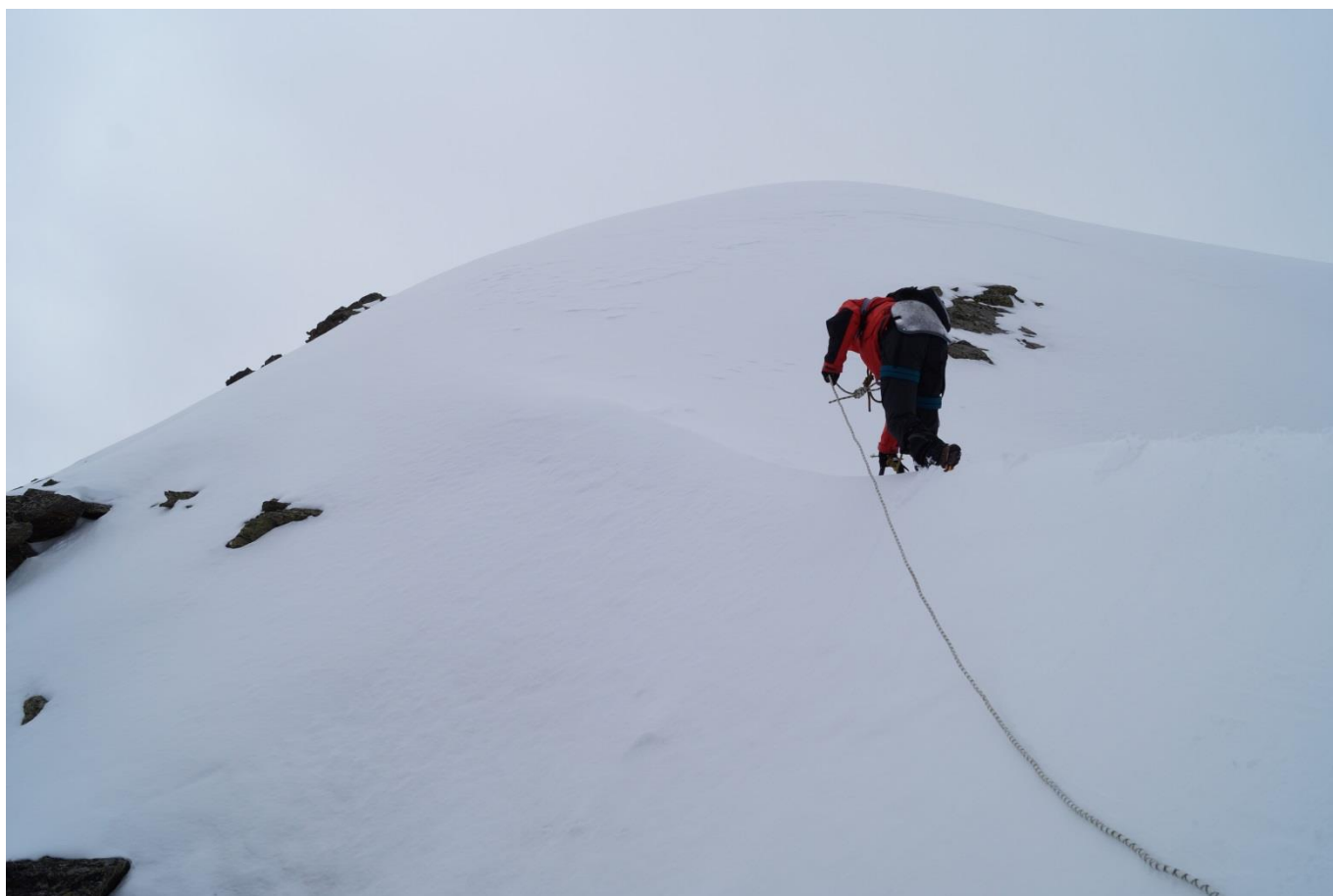
Рис.12. Участок R_3 - R_4