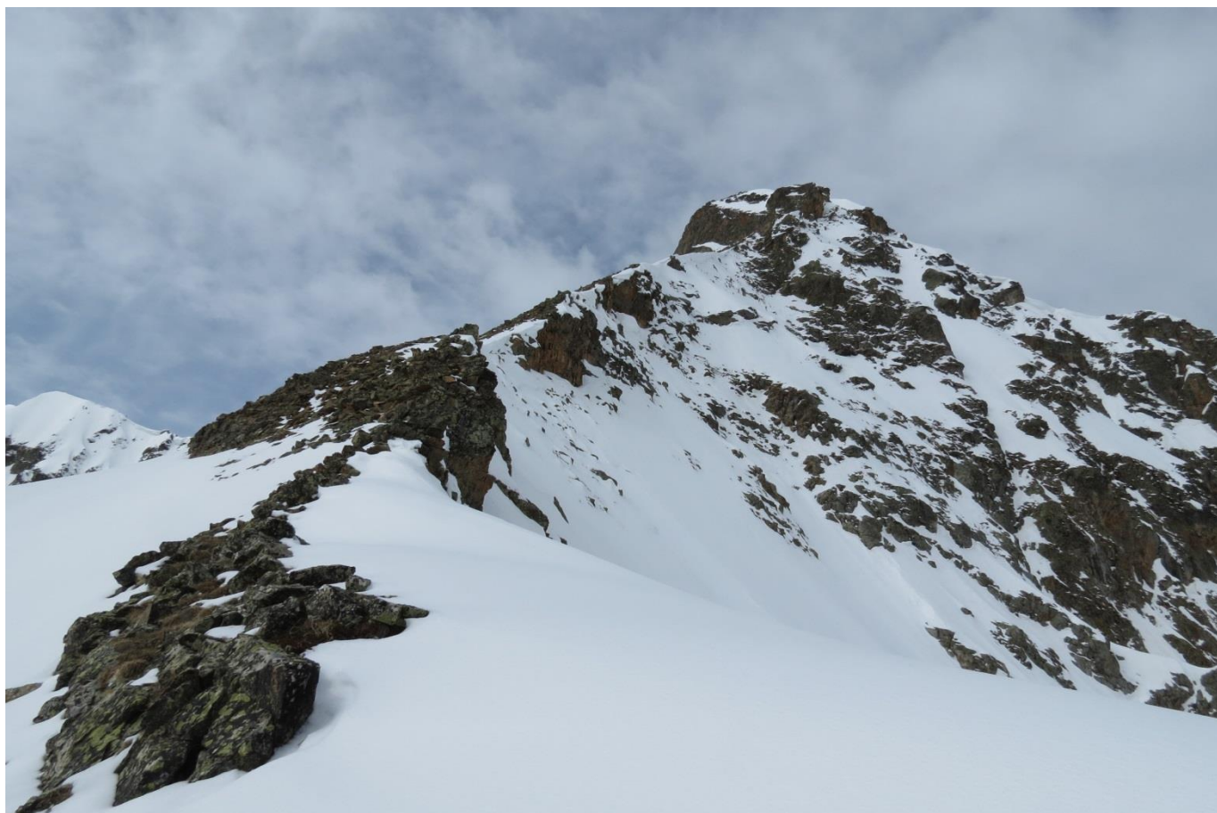
Рис.9. Восточный гребень скалы Горячева