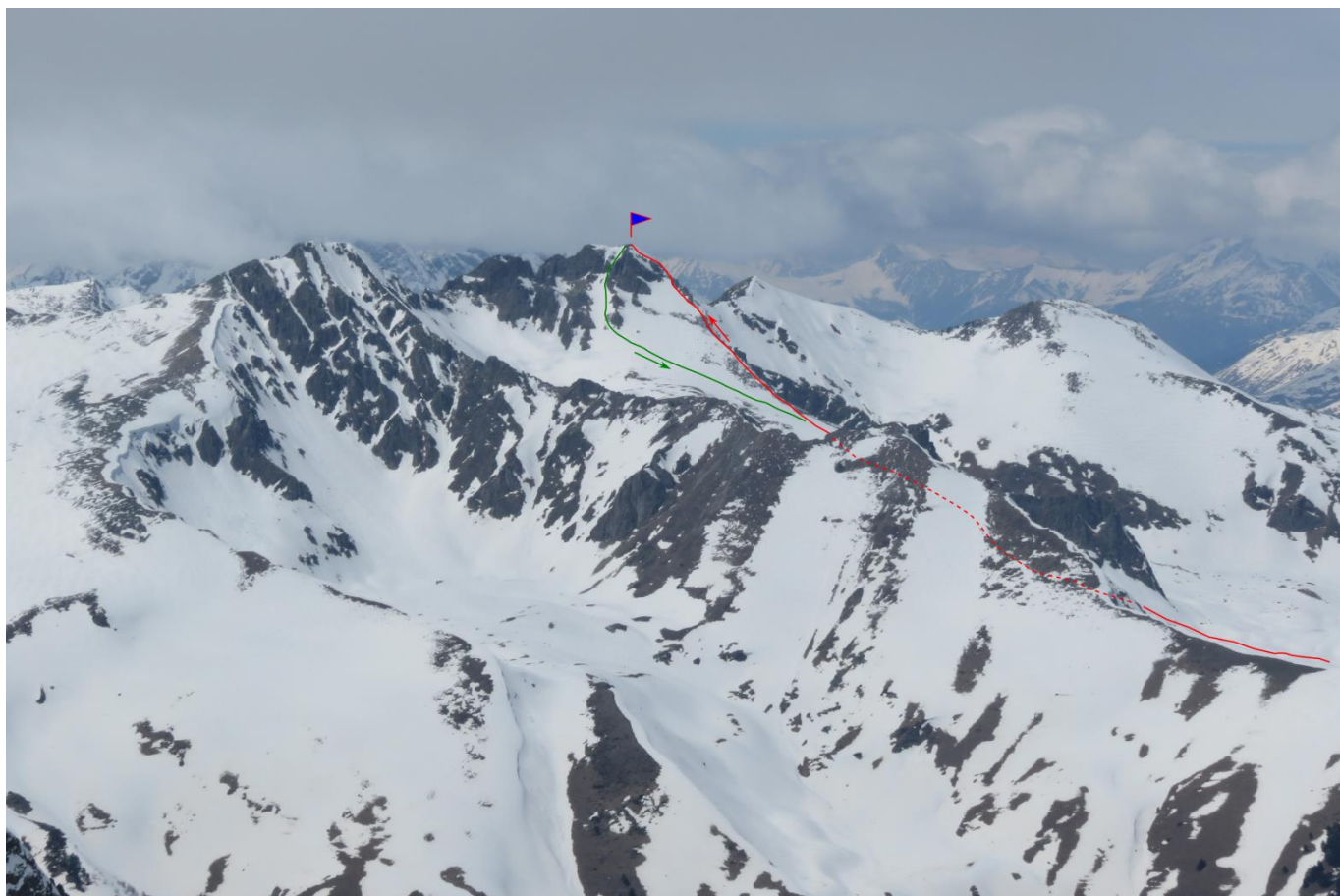
Рис.3 Вид на скалу Горячева с юго-востока (с вершины БСД). 6.05.2015г