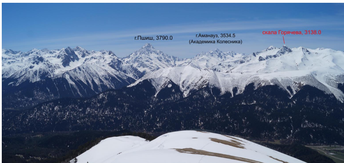
Рис.1 Общий вид района скалы Горячева с севера (со склонов хребта Абишира Ахуба). 3.05.2015г.