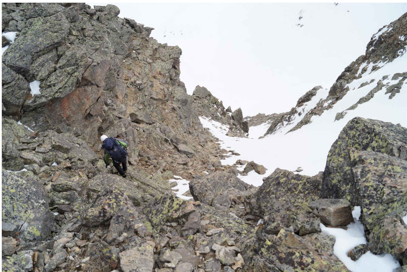
Рис.16. Спуск с вершины