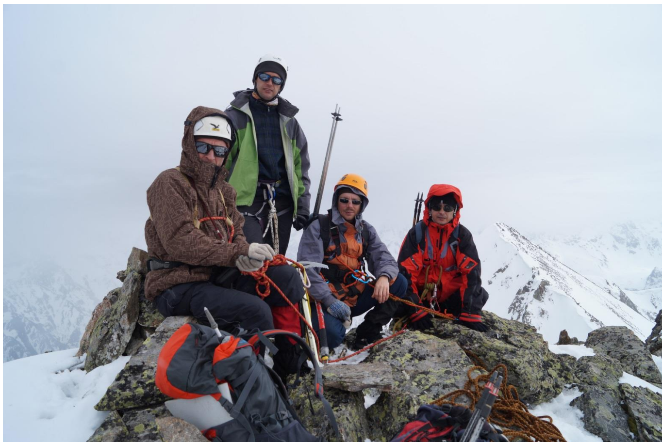
Рис.15. Группа на вершине