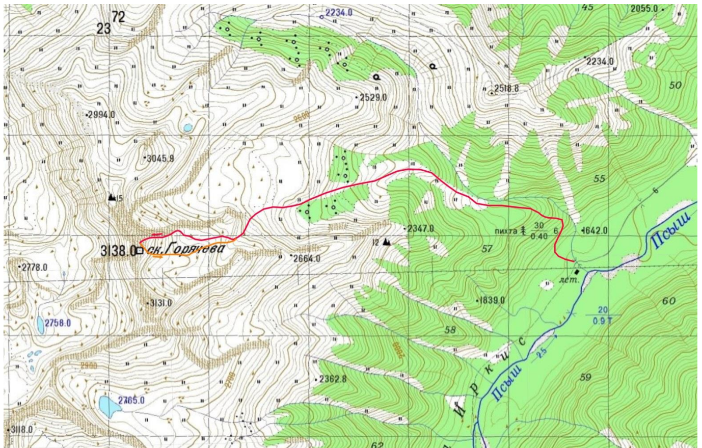
Рис.5. Схема маршрута восхождения