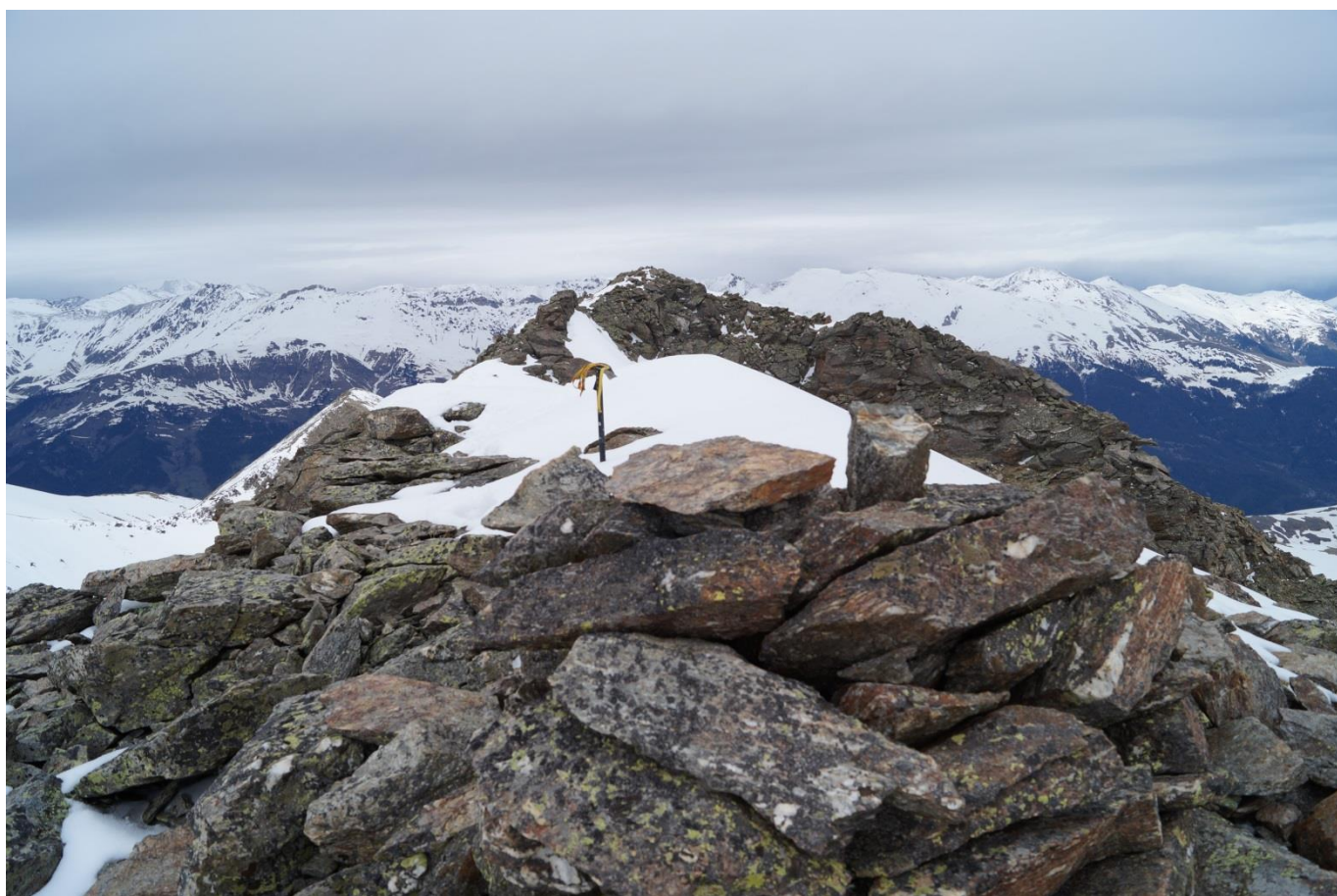
Рис.14. Вид с «геодезической вершины» на главную вершину