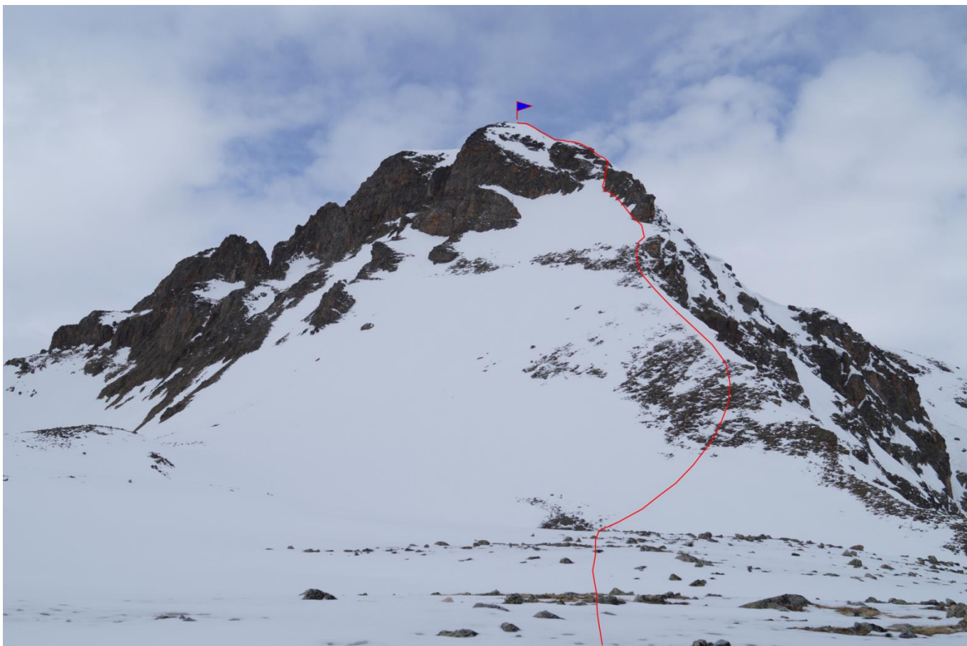
Рис.8. Подход к началу маршрута