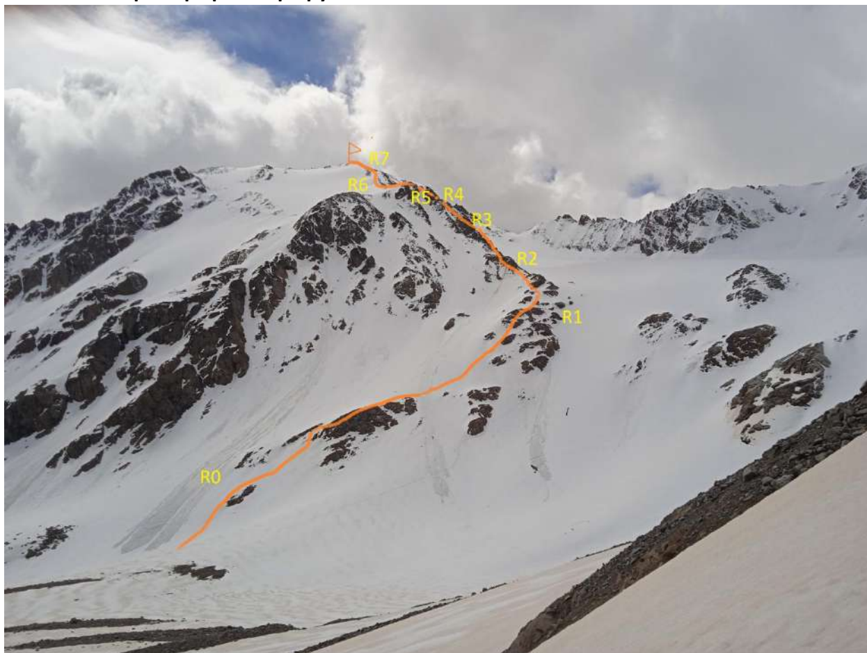
Техническая характеристика участков маршрута 2а к.т.