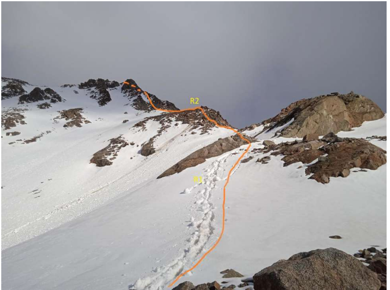
R1-R2 φωτο Νο 2