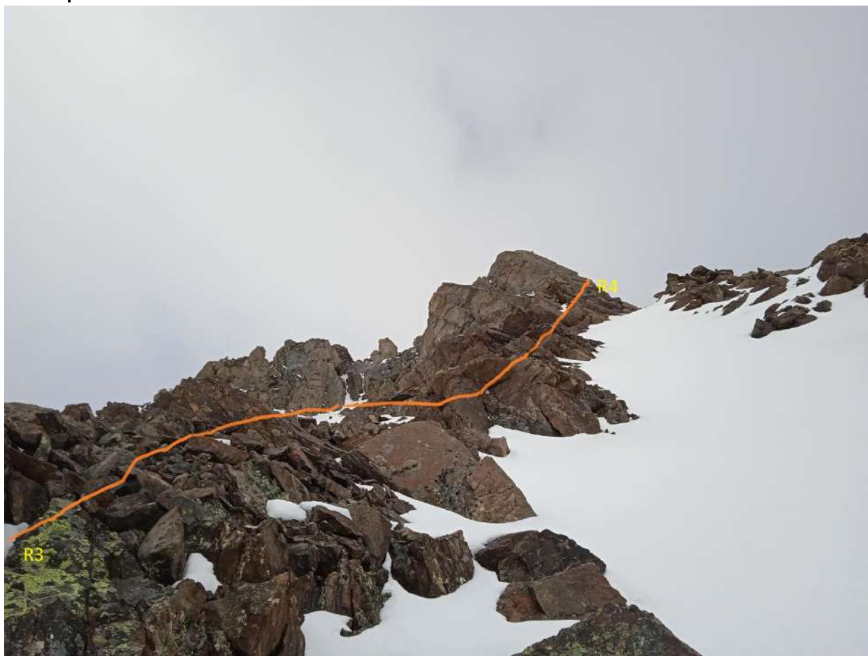
R3-R4. рис 4