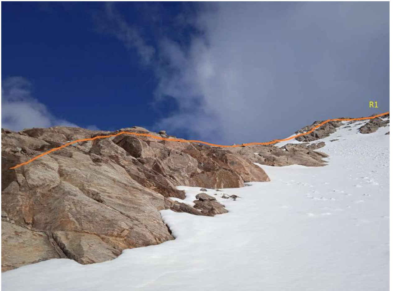
R0-R1 Рис. №1