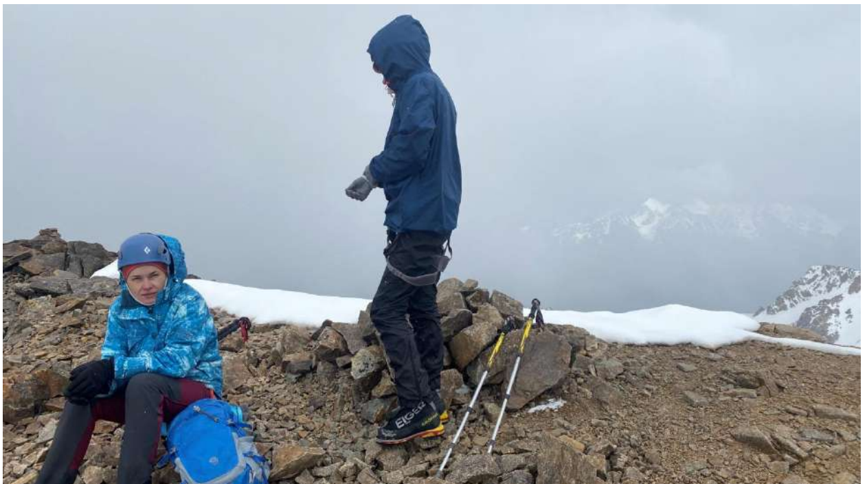
Фото на вершине