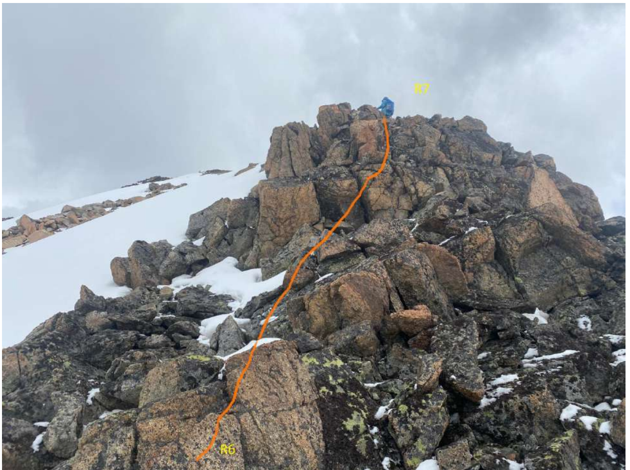
R6-R7 Рис. 7