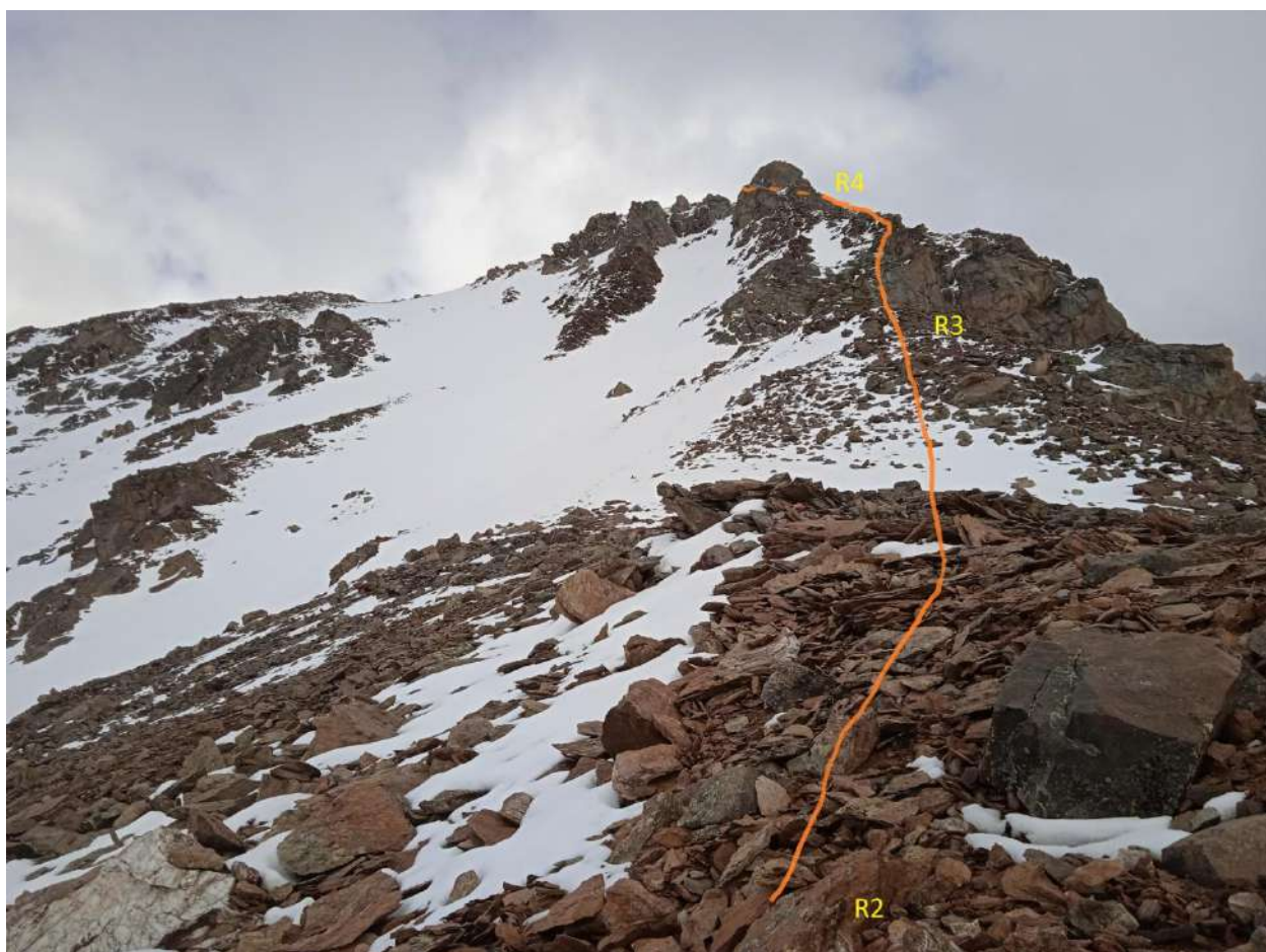
R2-R3 .R3-R4 Рис. №3