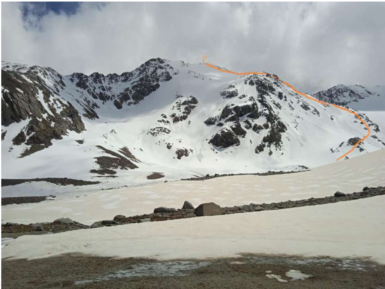
Фотопанорама района. снимок с реки Мукал