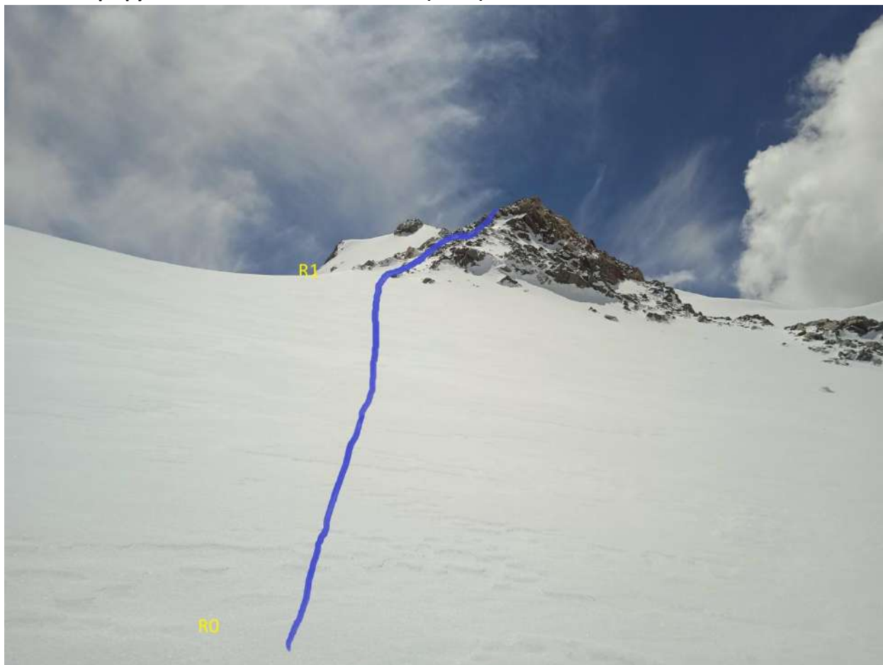
Начало маршрута 2а к.т в. Кезген R0-R1 R1-R2 (Рис.1)