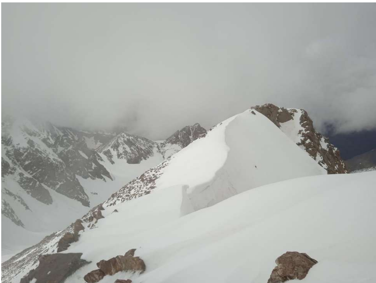
R6-R7 вид сверху рис 7