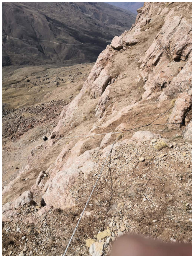
Рис. 5: Участок R2–R3. Вид снизу и сверху