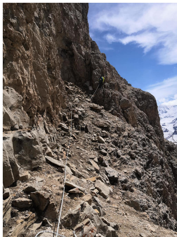
(б) Участок одновременного движения