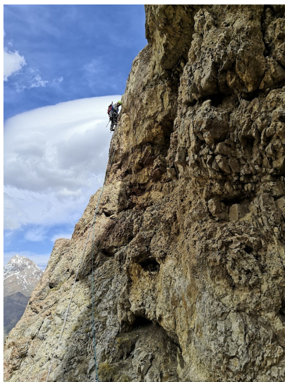
(б) ИТО на участке R6–R7. Вид из грота