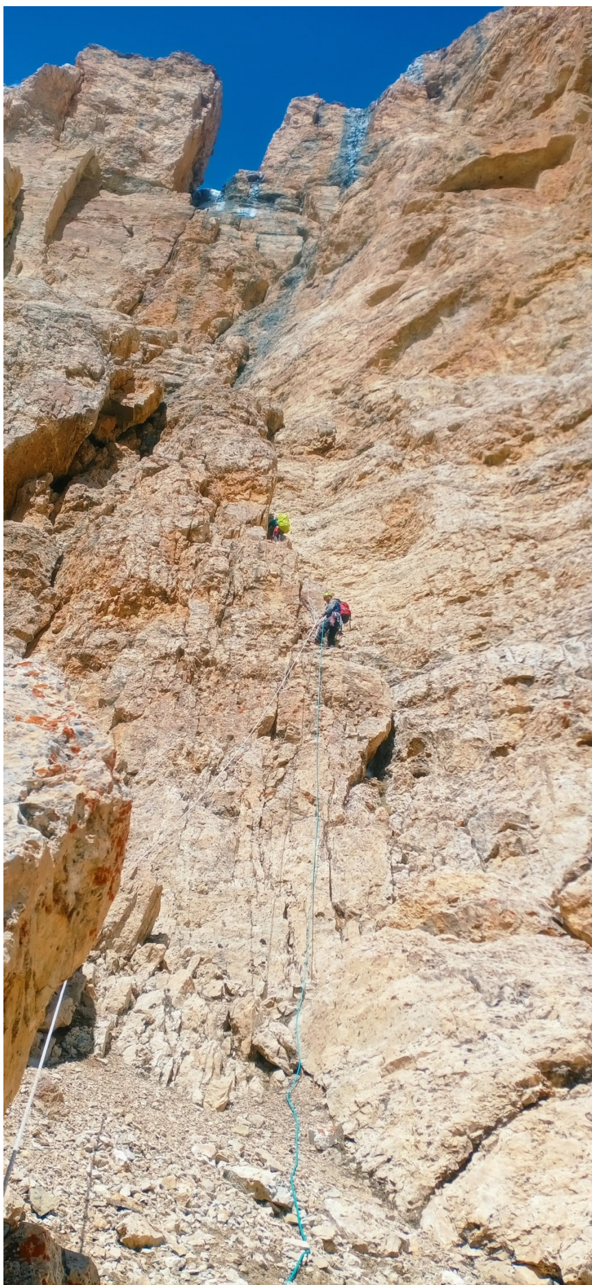
Рис. 9: Вид на верхнюю часть маршрута R9–R13