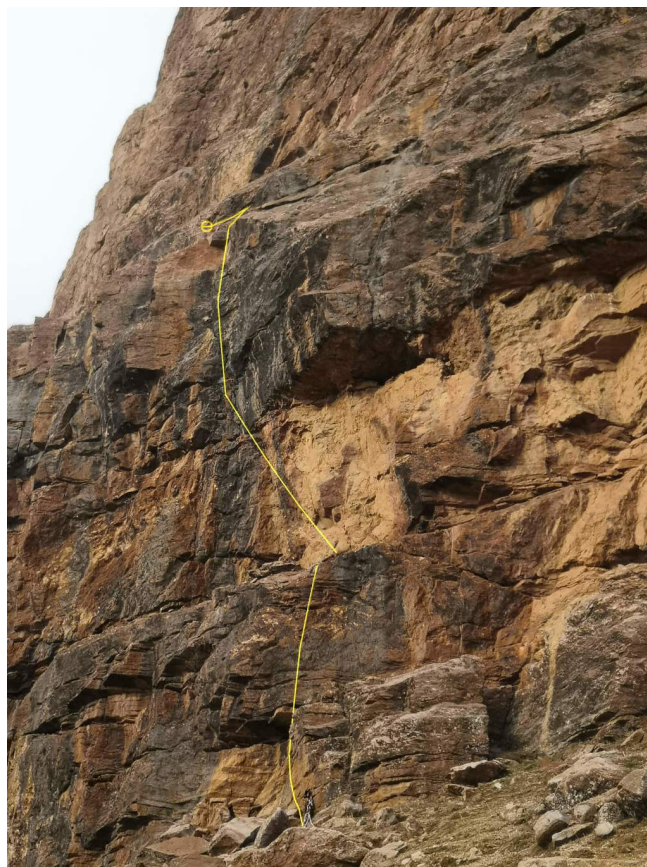
Рис. 3: Начало маршрута. На правой фотографии видна провешенная первая веревка