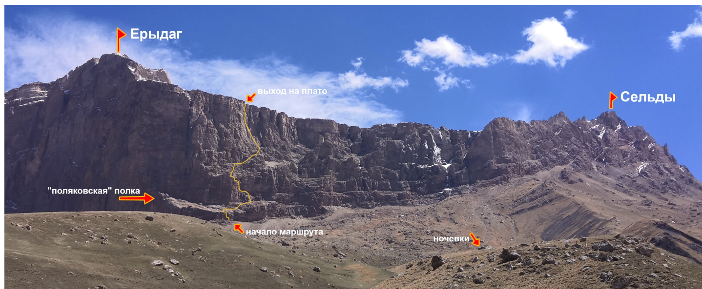
Рис. 1: Фотография района