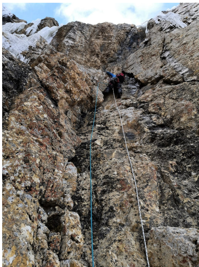
Рис. 10: Работа на участках R13–R15 перед выходом на плато