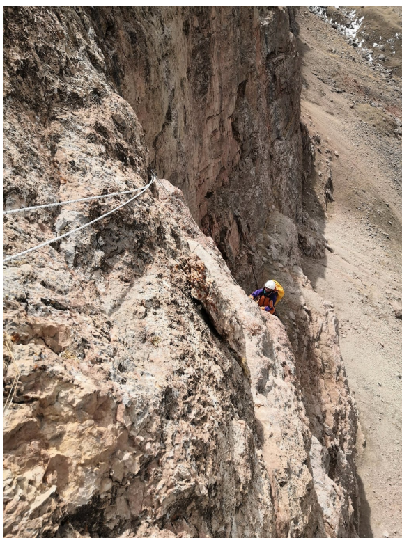
(а) Вид со станции R7