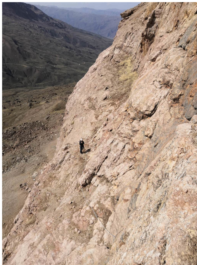
Рис. 4: Участок R1–R2. Вид снизу и сверху