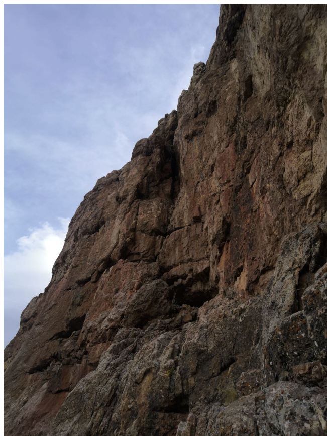
Рис. 6: Участки R3–R4 и R4–R5