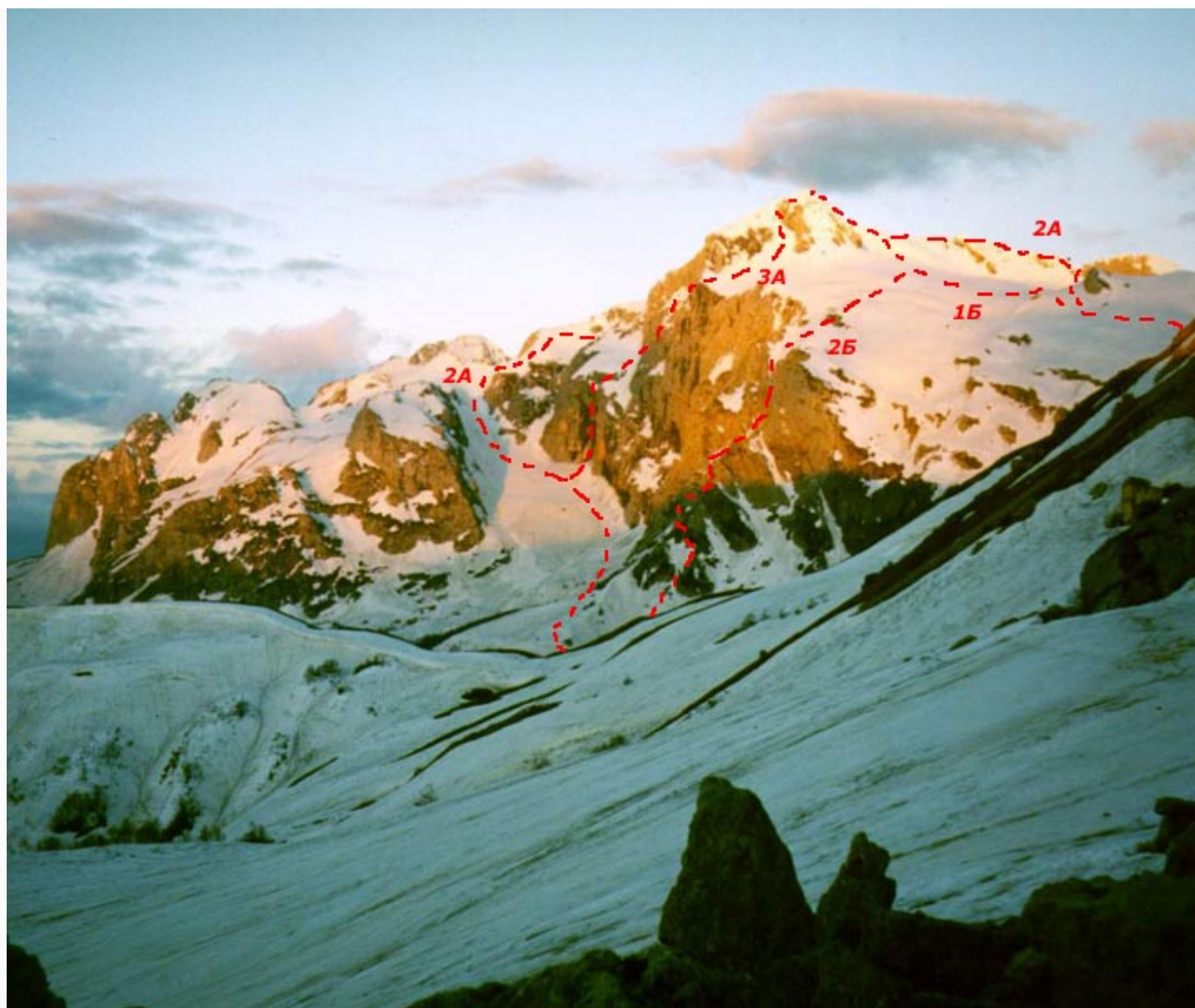
Гора Фишт (2867 м). Нить маршрут 2А к.с. по ЮВ гребню (слева на схеме)