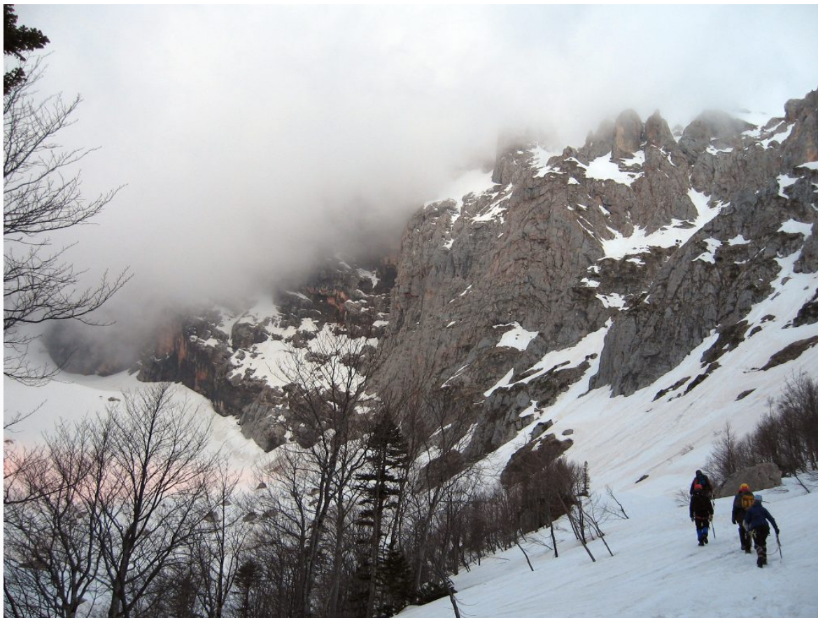
Подходы под маршрут

На перевале свернуть на право и по крутому снежному склону, переходящему в кулуар, подойти под скальный взлет.