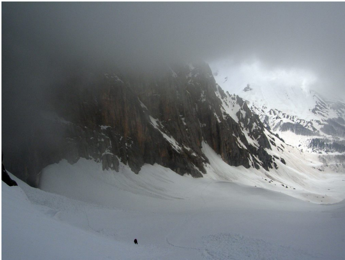
Снежный склон, переходящий в кулуар