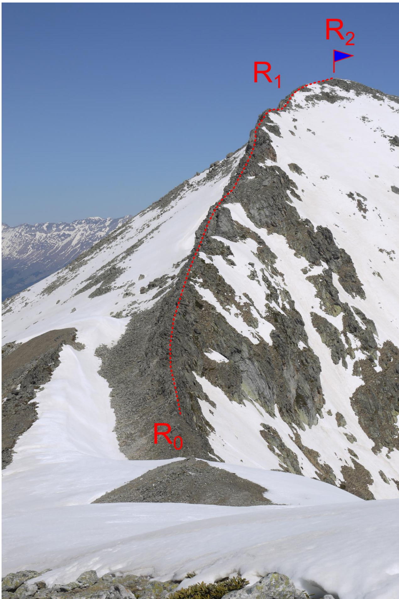
Рис.4. Фото маршрута