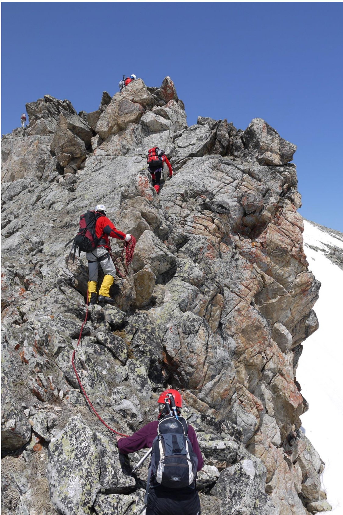
Рис.7. Участок R_0 - R_1 .