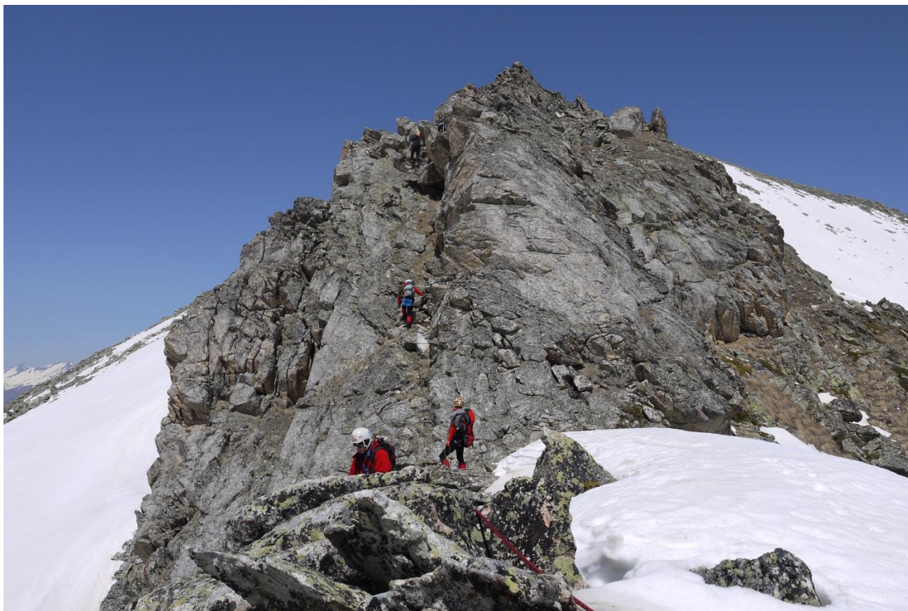
Рис.6. Участок R_0 - R_1