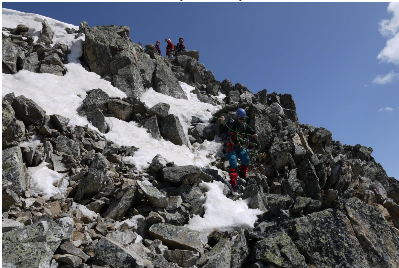
Рис.10. Спуск с вершины