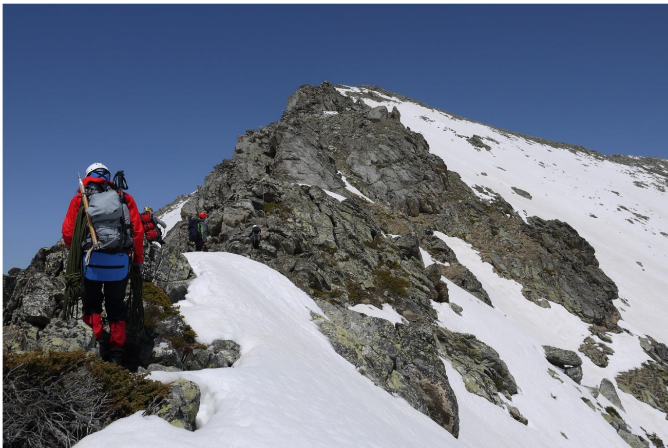
Рис.5. Участок R_0 - R_1