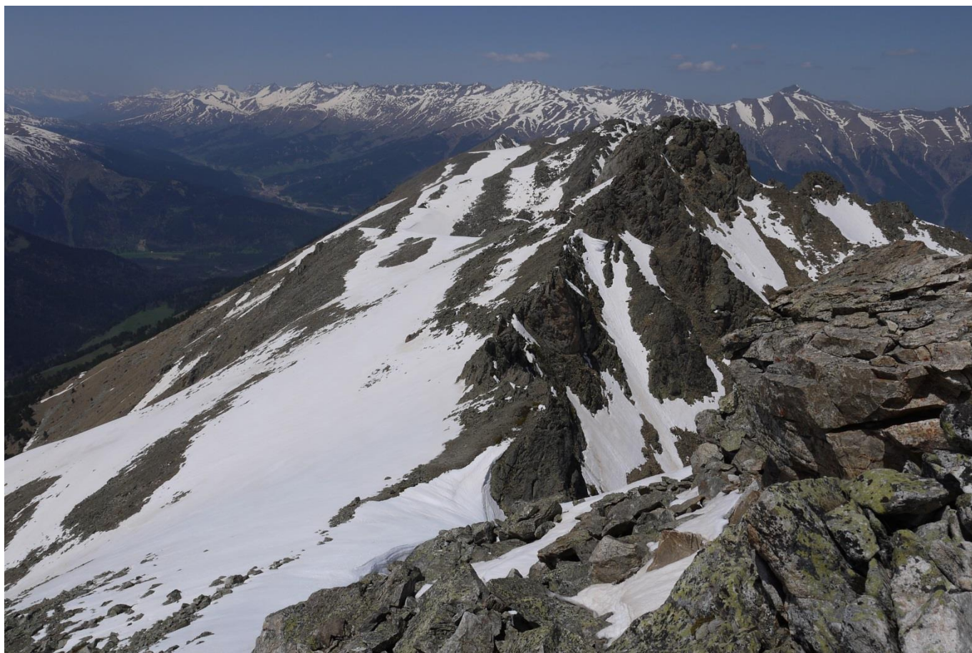
Рис.9. Вид с вершины на северо-запад.