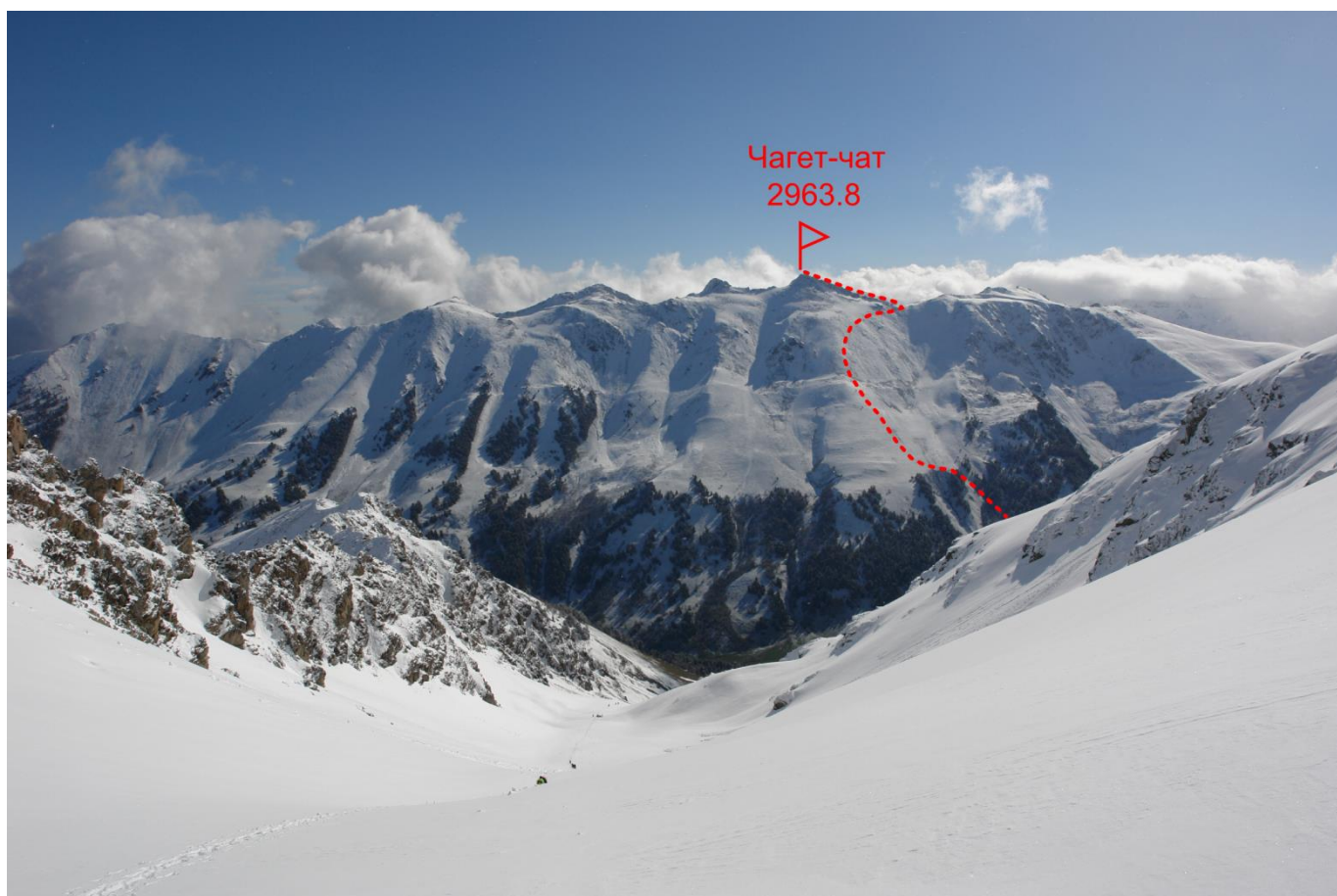
Рис.1 Общий вид хребта Чагет-чат с запада. 8.05.2008г.