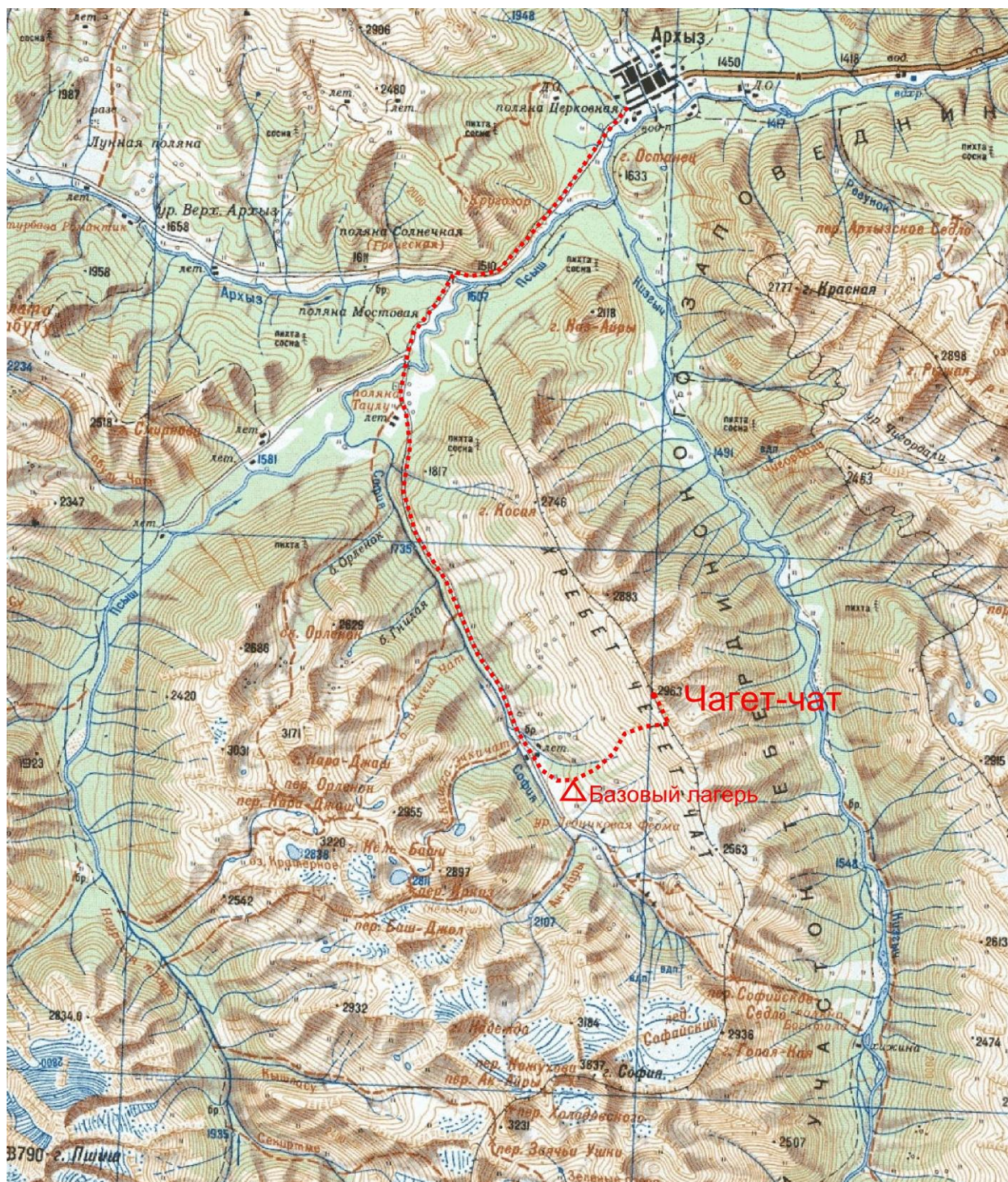
Рис.3. Обзорная карта района