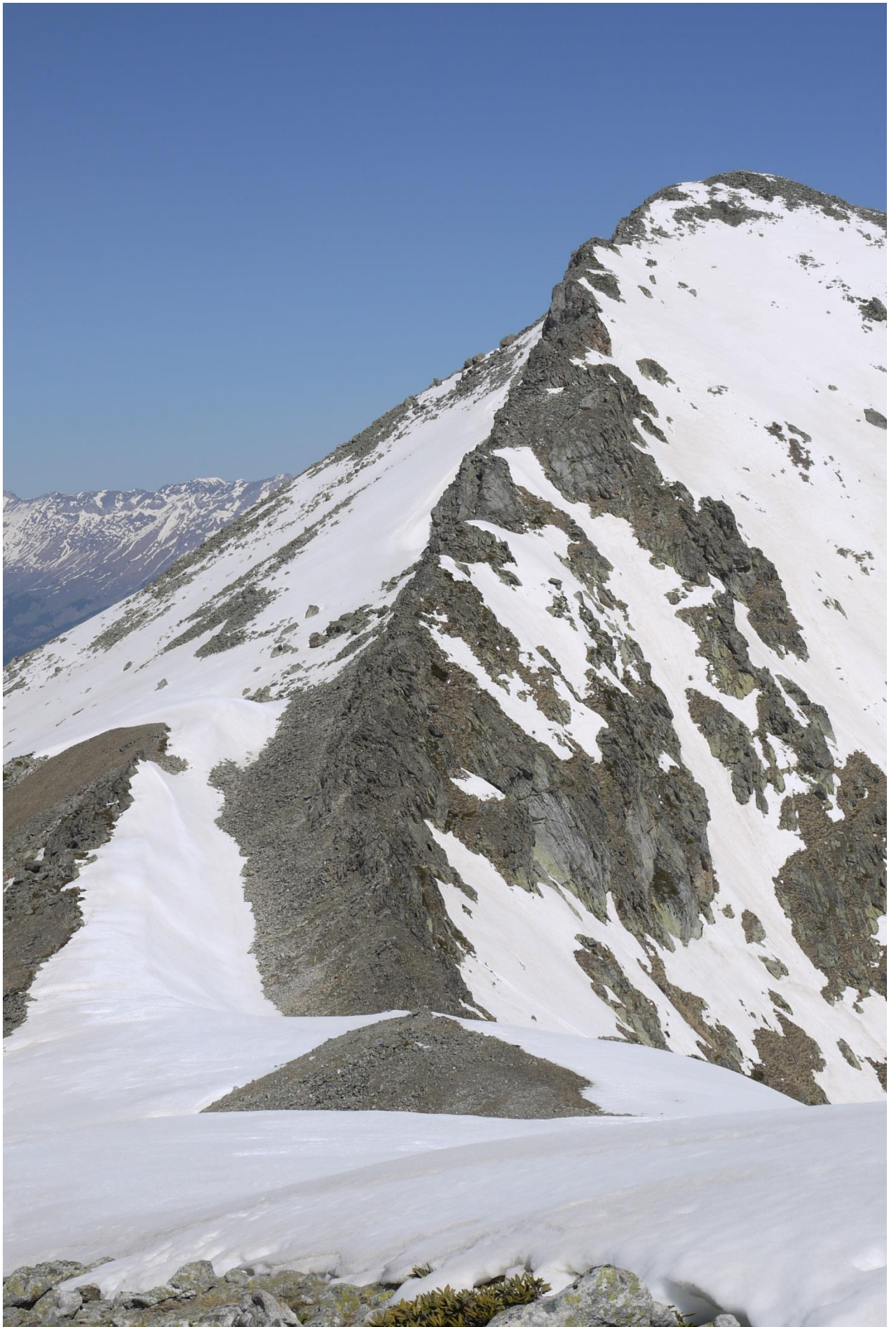
Рис.2 Общий вид юго-восточного гребня вершины Чагет-чат с юго-востока. 2.05.2013г