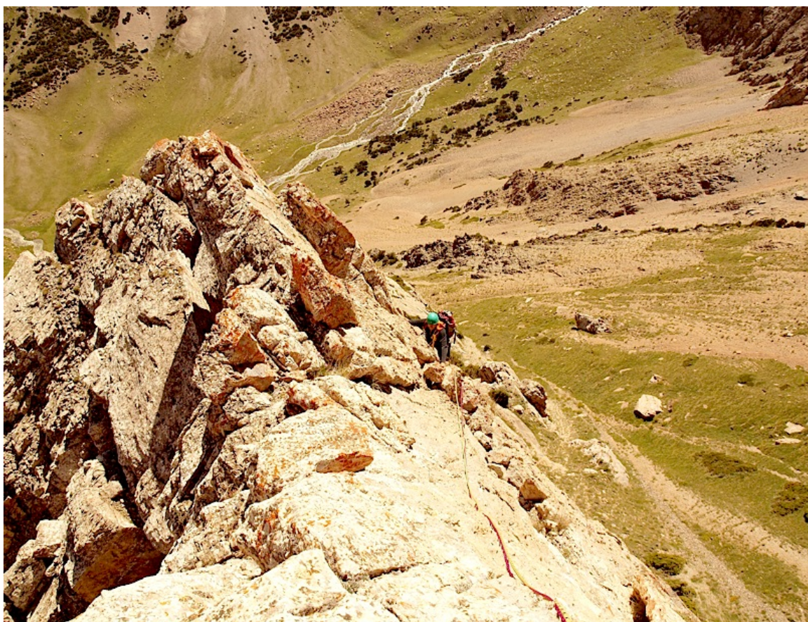
Участок 3. Гребень.