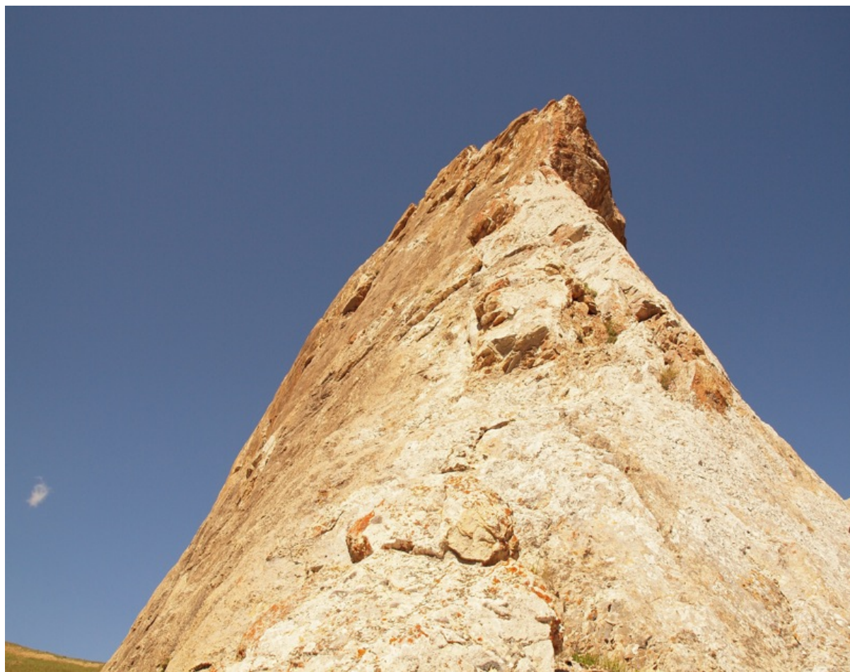
Начало гребня, после участка 2.