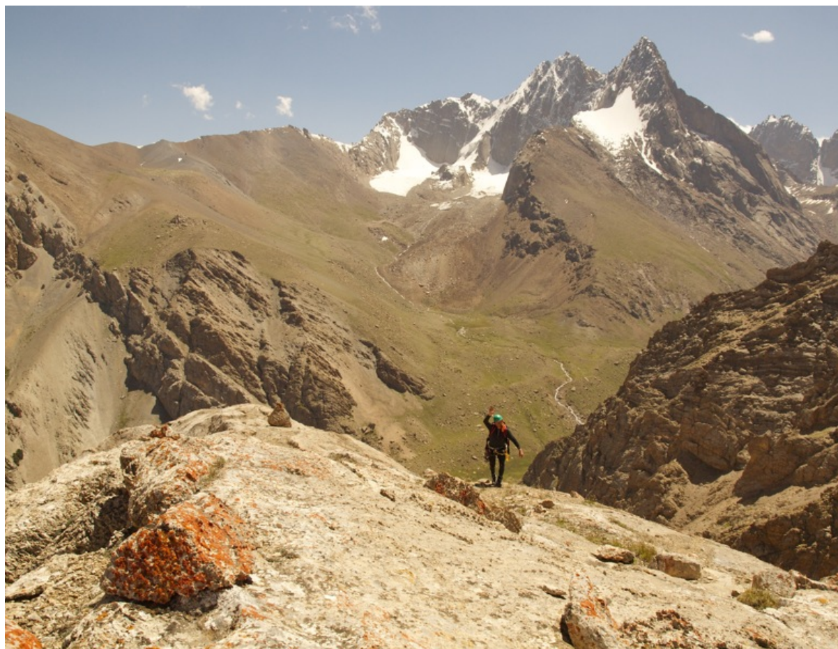
Вершина, 3900 м.