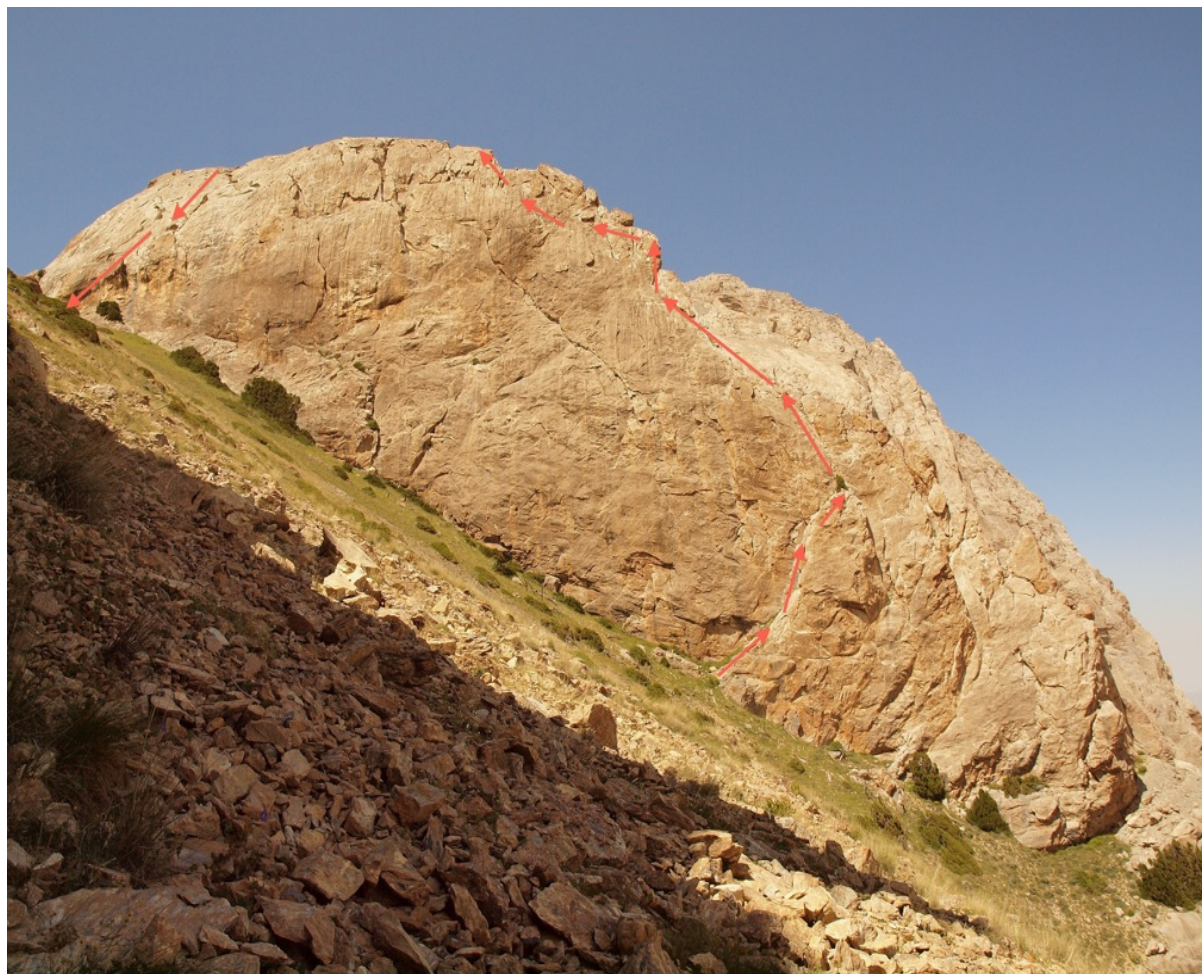
Маршрут команды по В гребню.