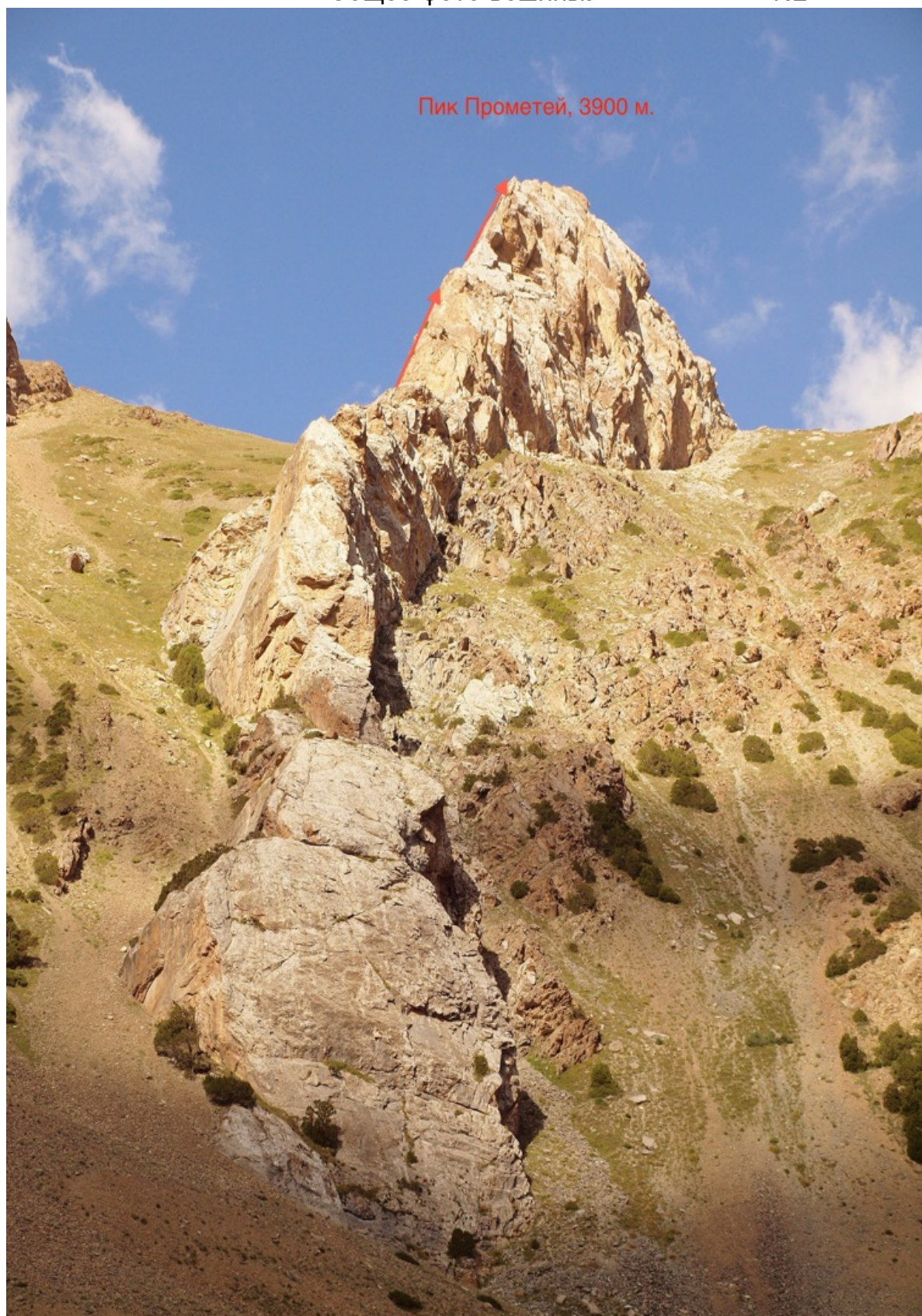
Пик Прометей (рабочее название) 3900 м., маршрут команды по В гр.