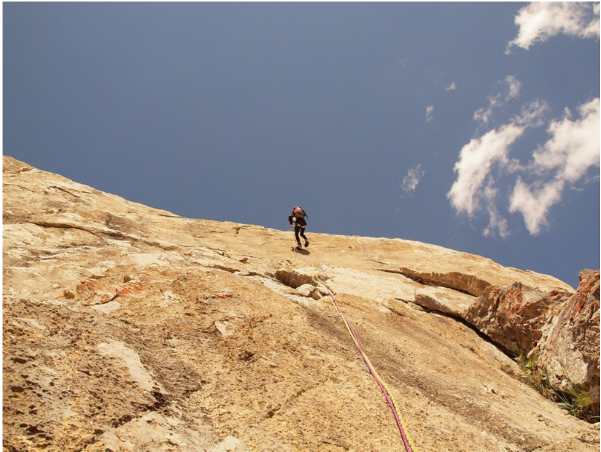
Спуск по Ю стене, на перевал.