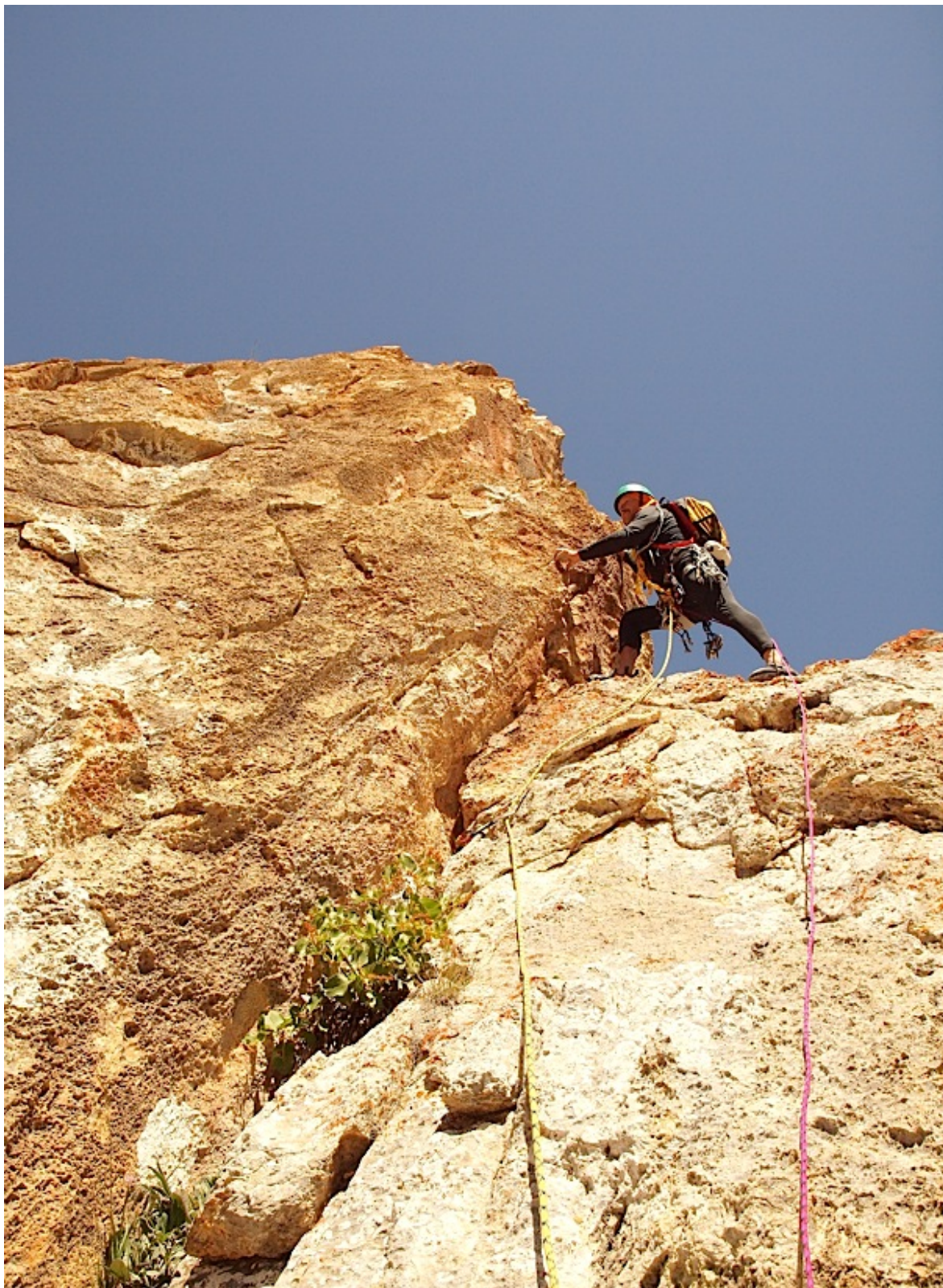
Начало участка 4.