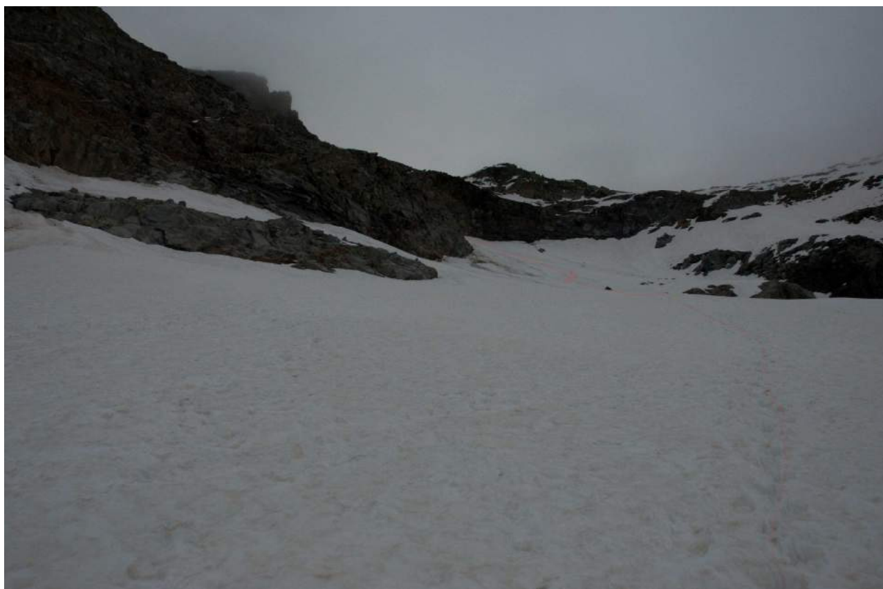
Фото 3. участок R0-R1