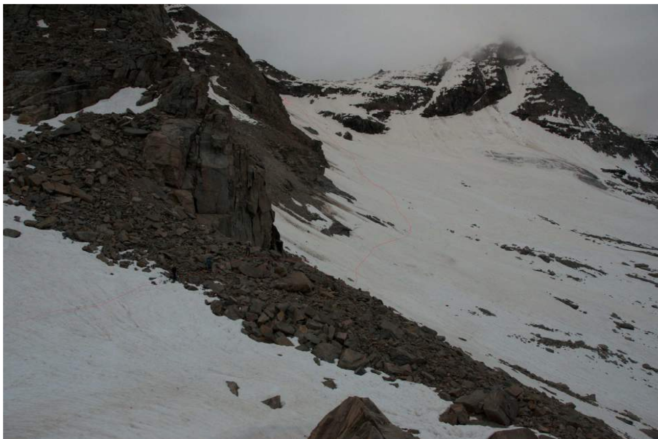
Фото 2. Заход на маршрут с ледника между Чиарфороном и Мончиаром