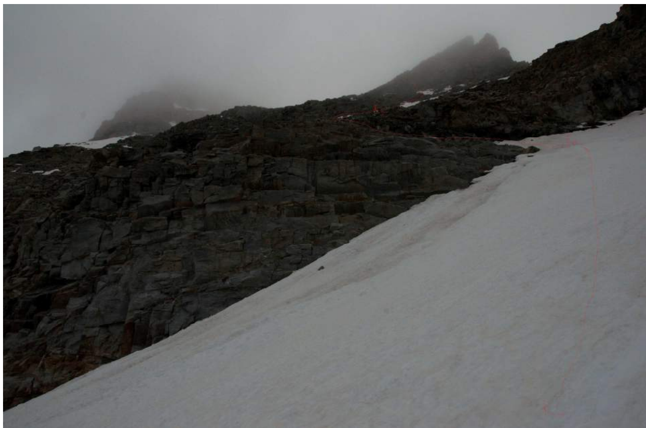
Фото 4. участок R1-R2