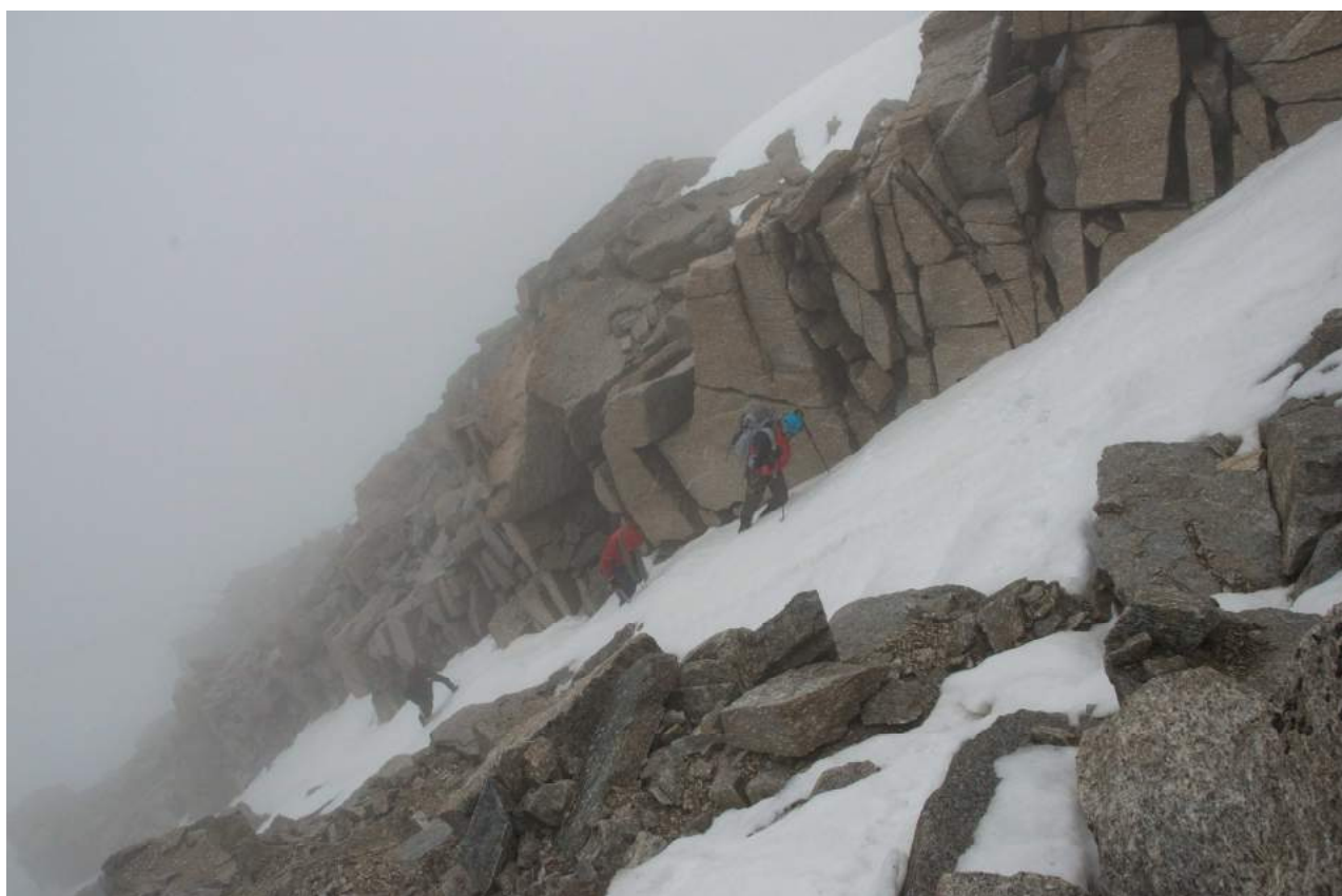
Фото 6. Начало ледово-снежного кулуара на участке R4-R5