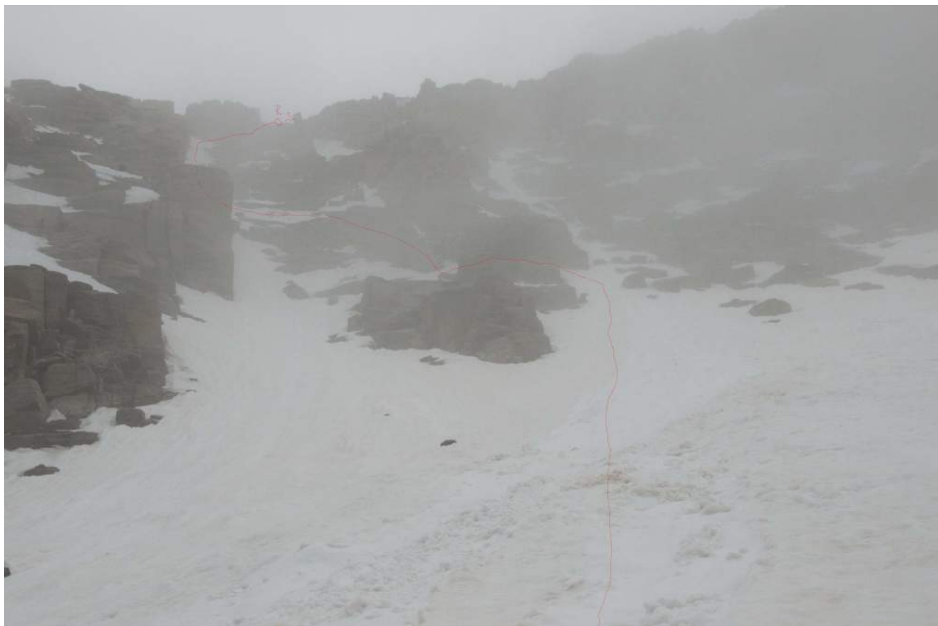
Фото 5. участок R4-R5