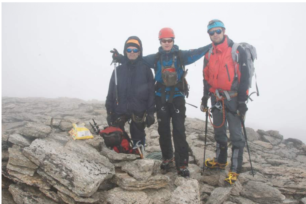
Фото 7. Группа на вершине