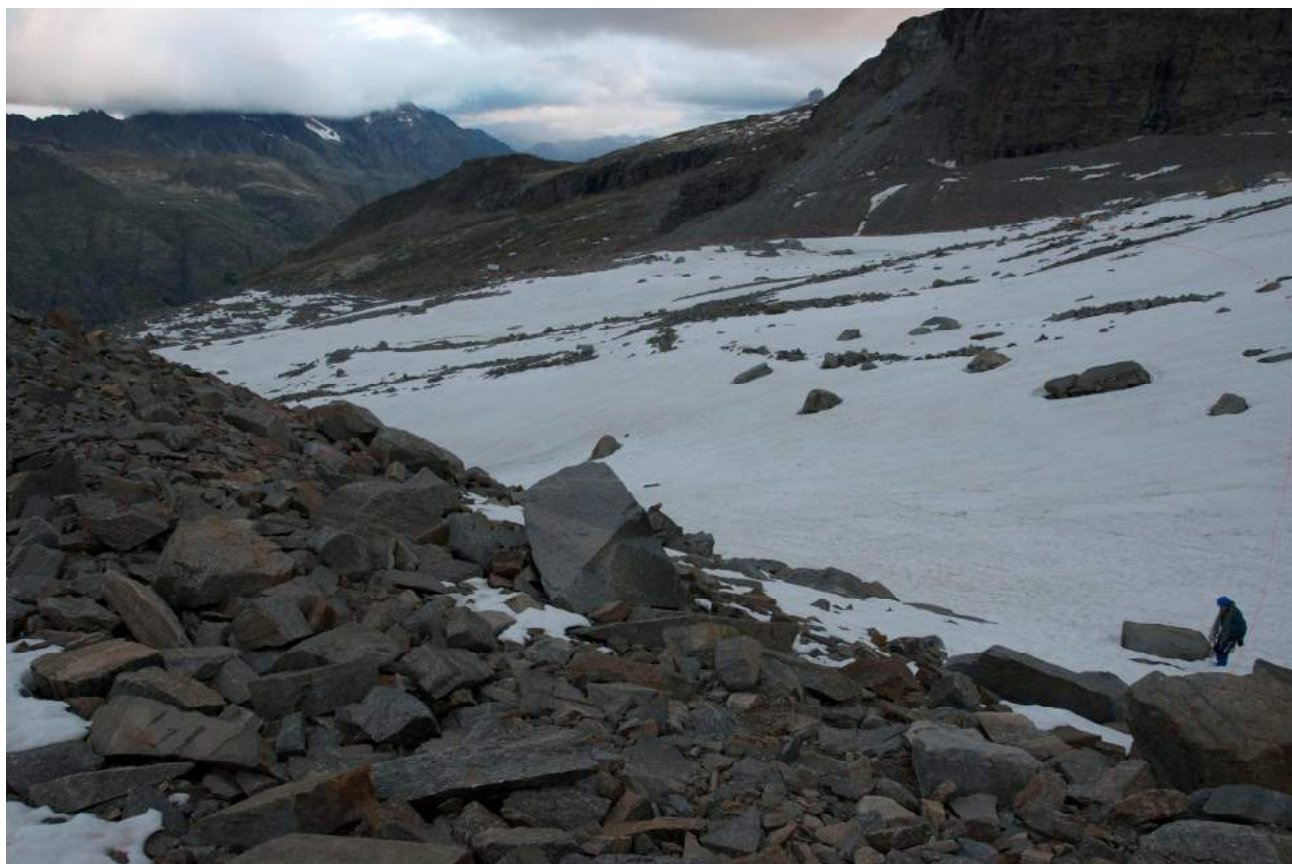
Фото 1. Подход от хижины В. Эммануэля II