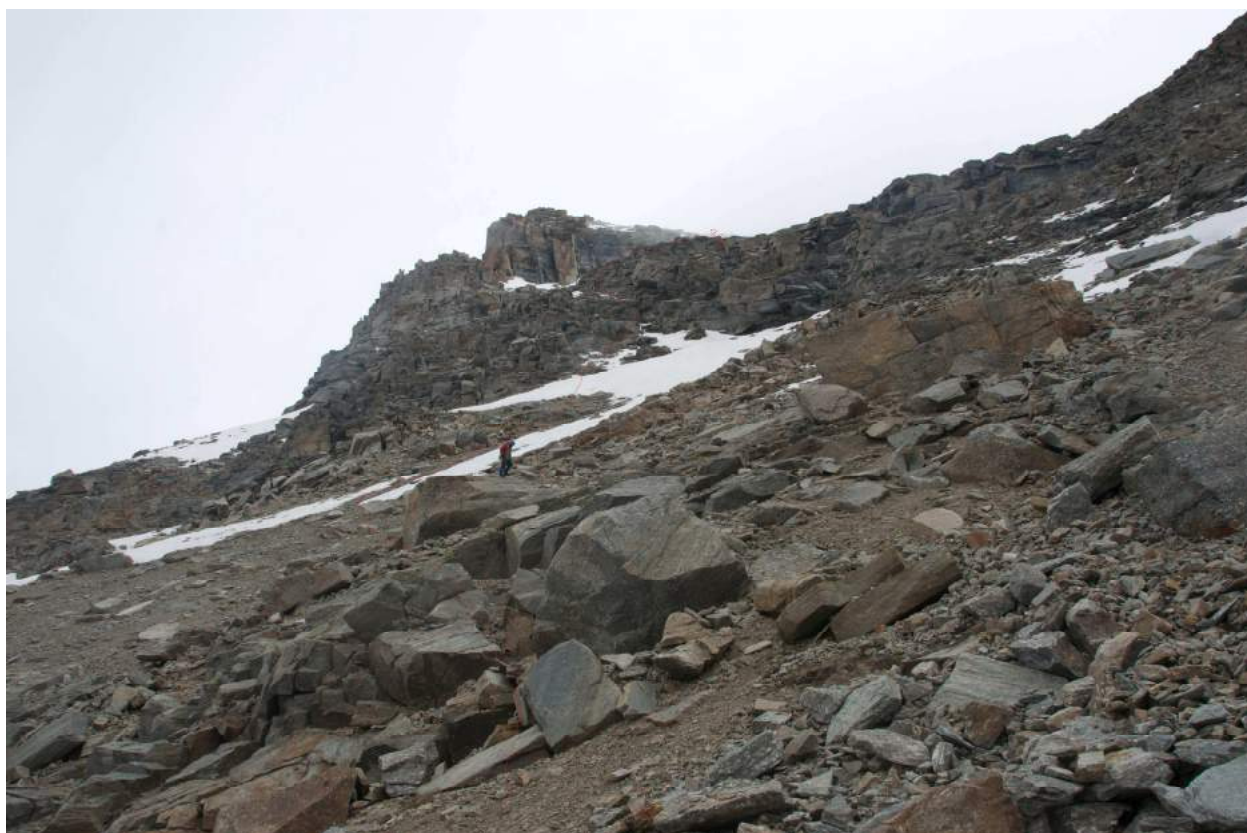
Фото 5. участок R2-R3