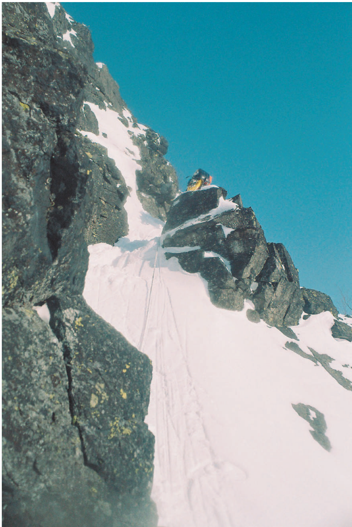
Фото участков маршрута