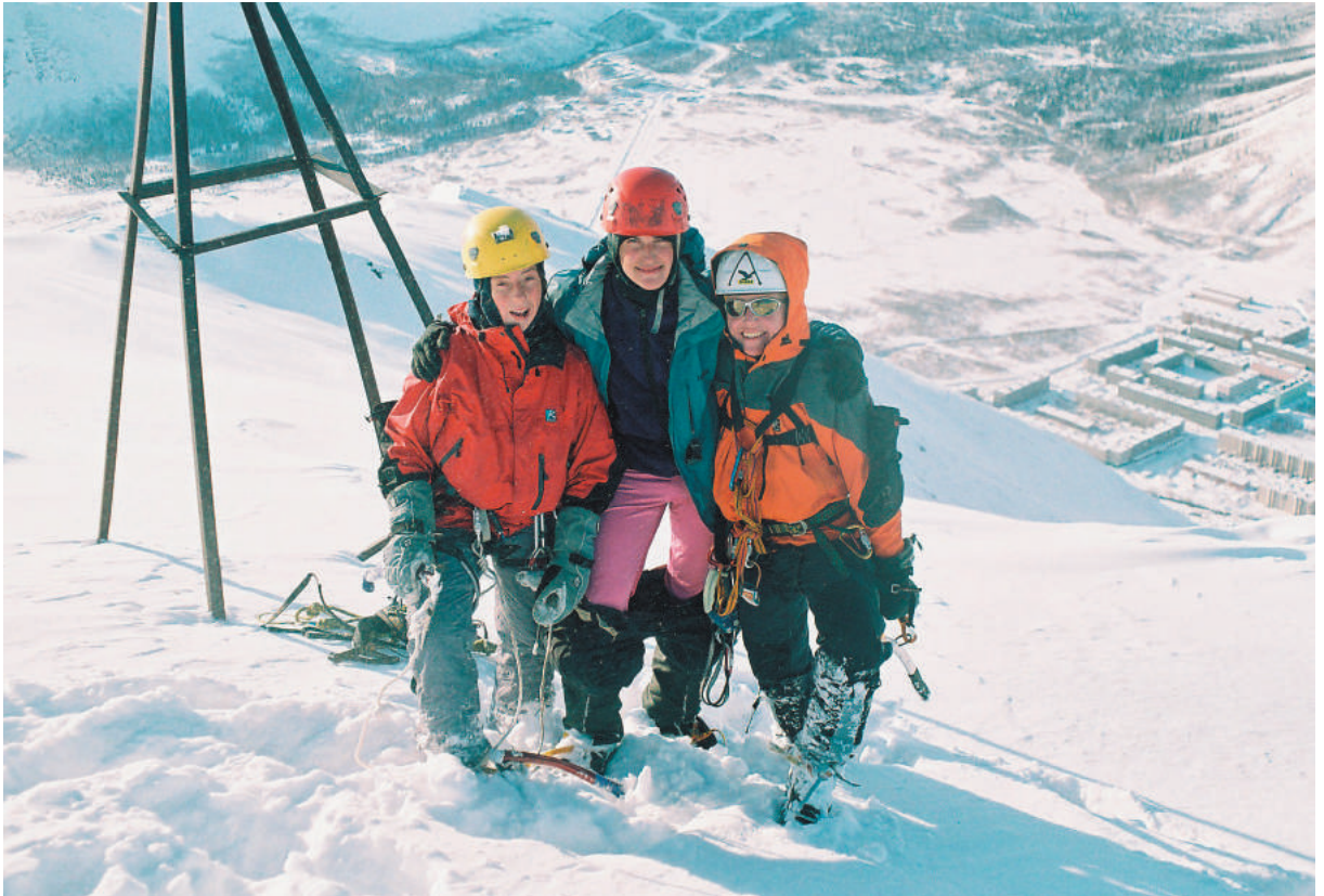
На вершине Юкспорра