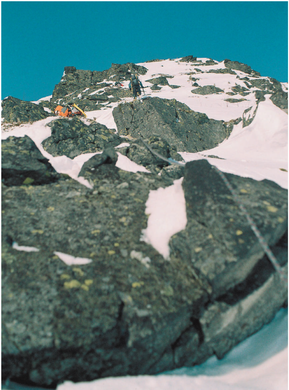
Фото ребра контрофорса