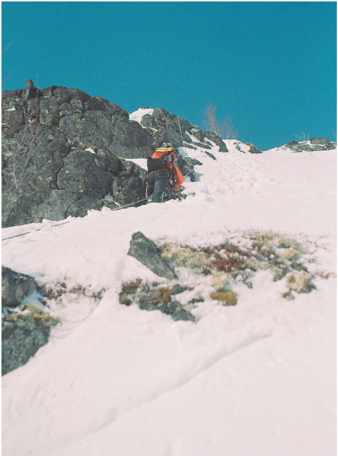
Фото участков маршрута