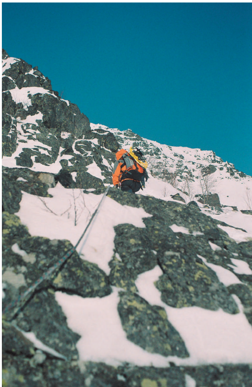
Фото участков маршрута