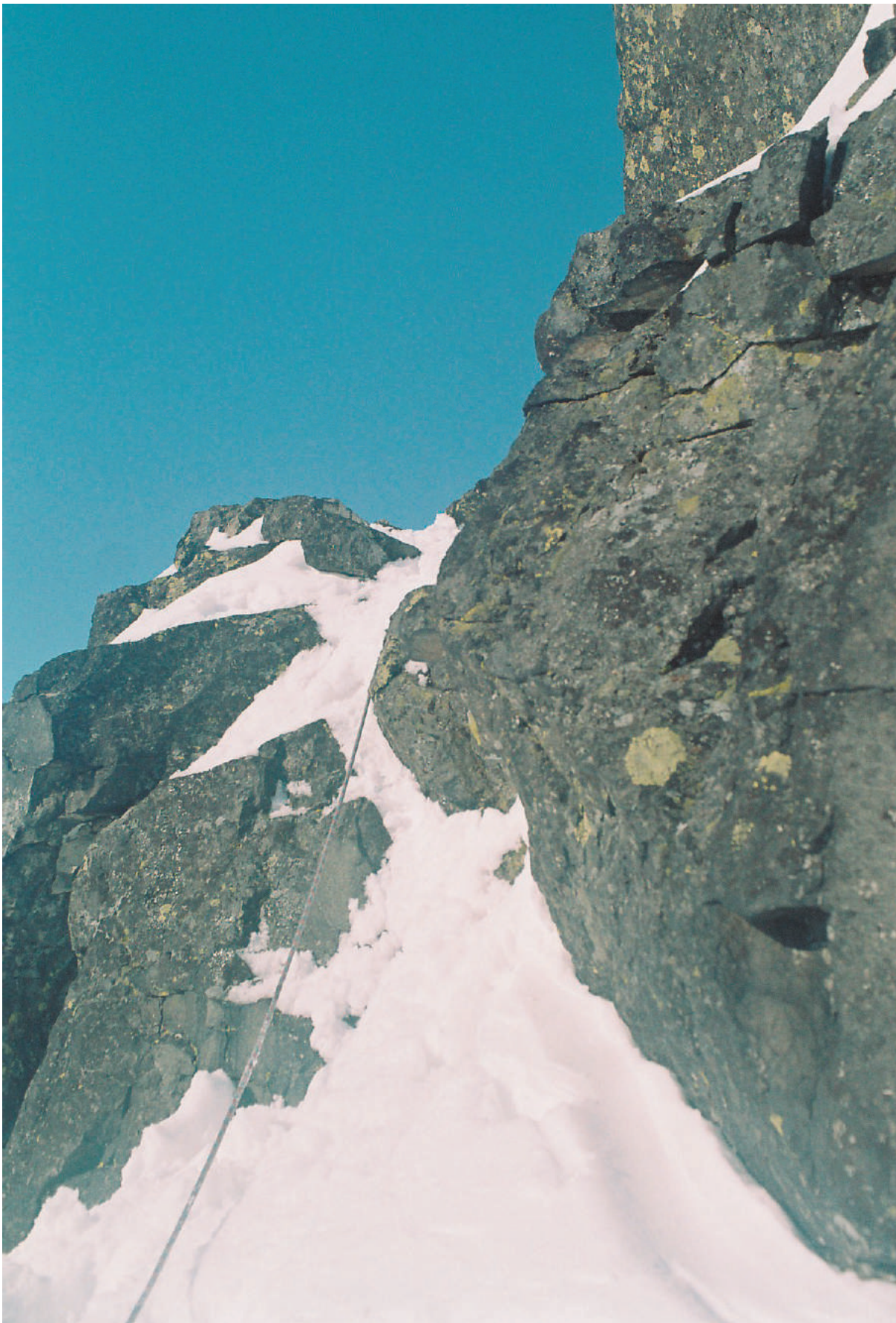
Фото участков маршрута