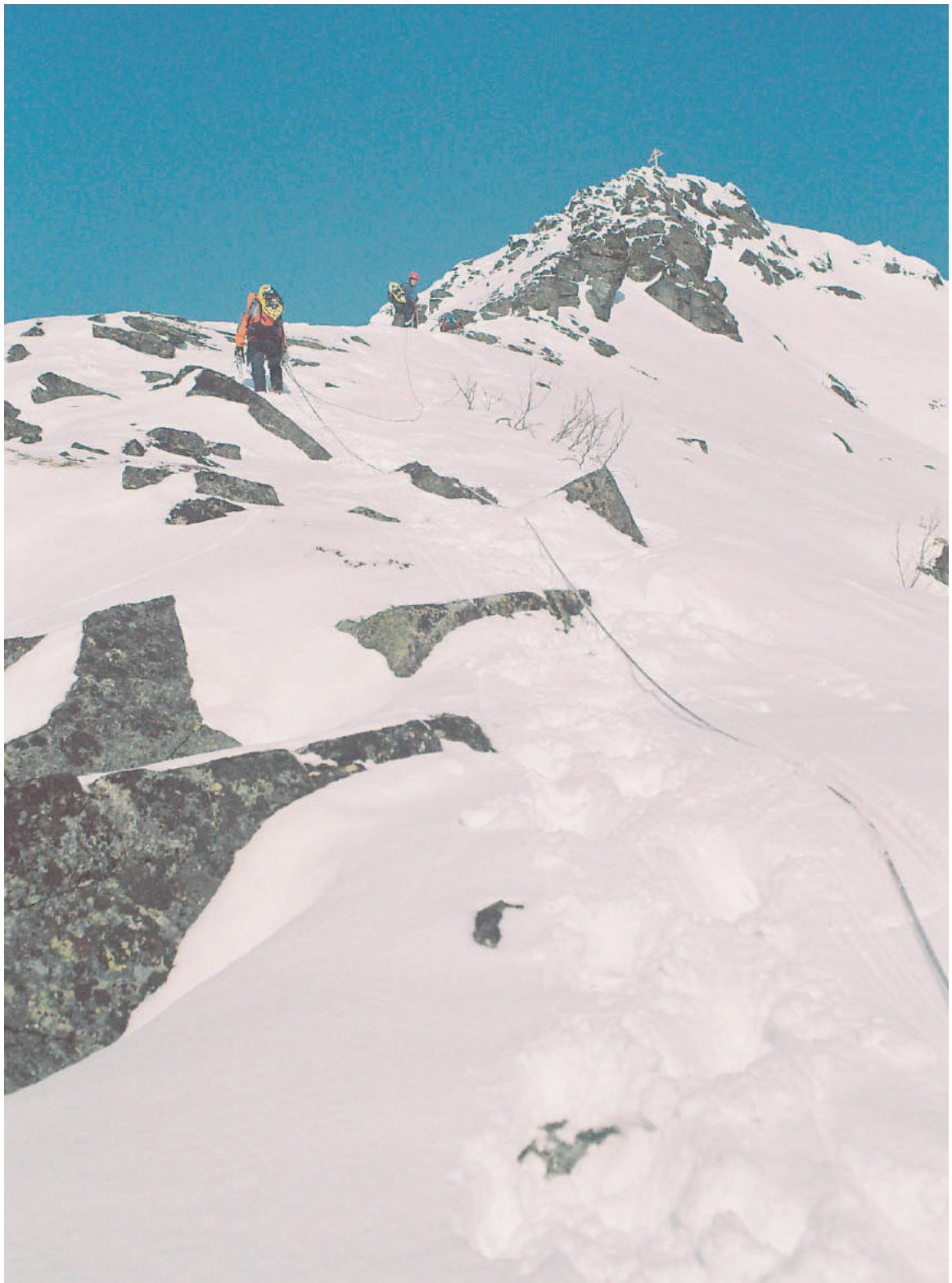
Фото верхней части контрфорса. Выход на предвершину