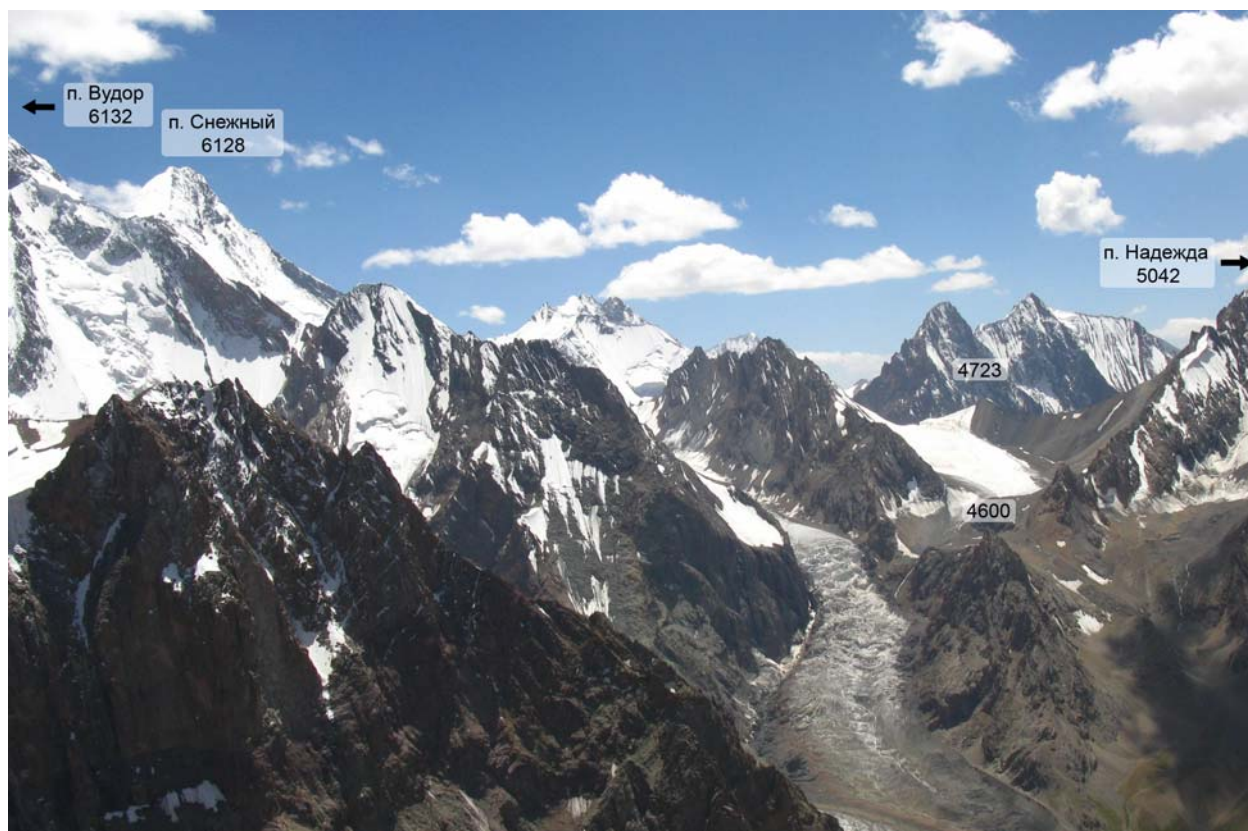
Рис. 2. Панорама с.-з. отрога Язгулемского хребта, отходящего от п. Снежный. Снимок выполнен 28 июля 2008 г. со склона п. Динозавр.