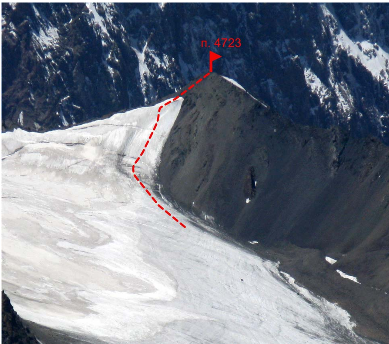
Рис. 1. Фотография восточного склона п. 4723. Снимок выполнен 28 июля 2008 г. со склона п. Динозавр.