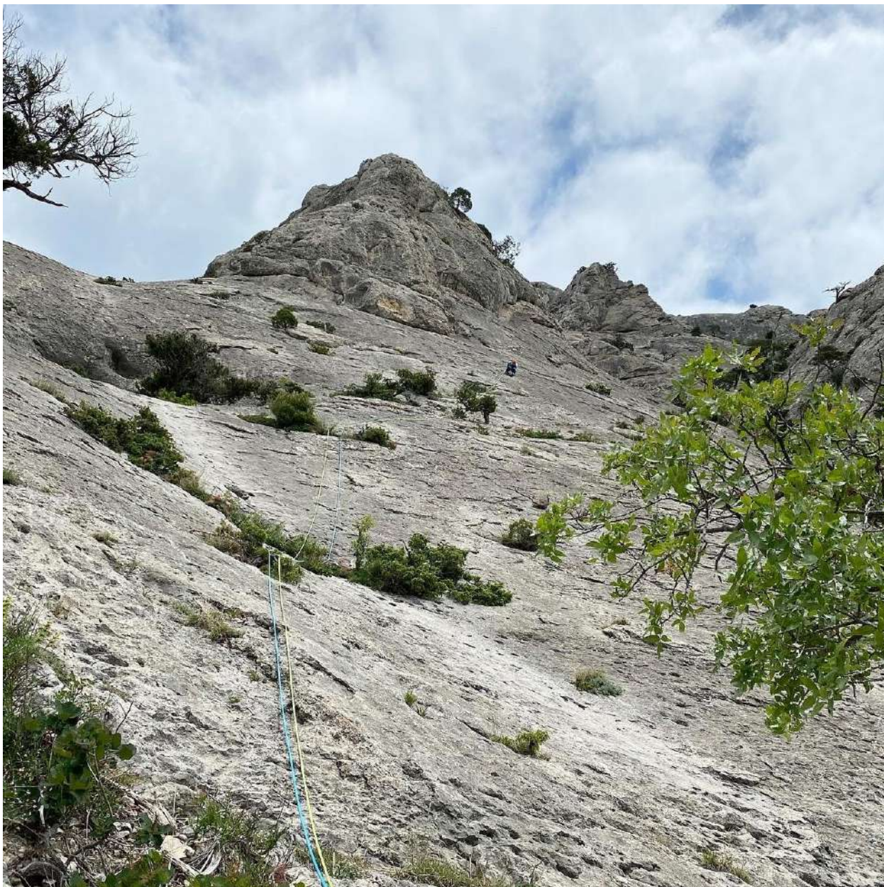
Фото 5. Участок R1-R2