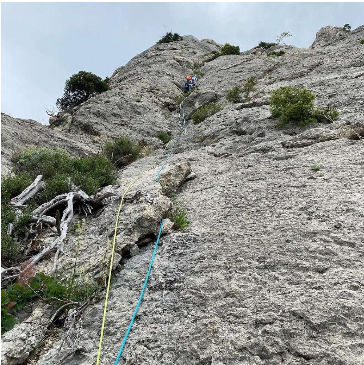
ФОТО 4. Участок R0-R1