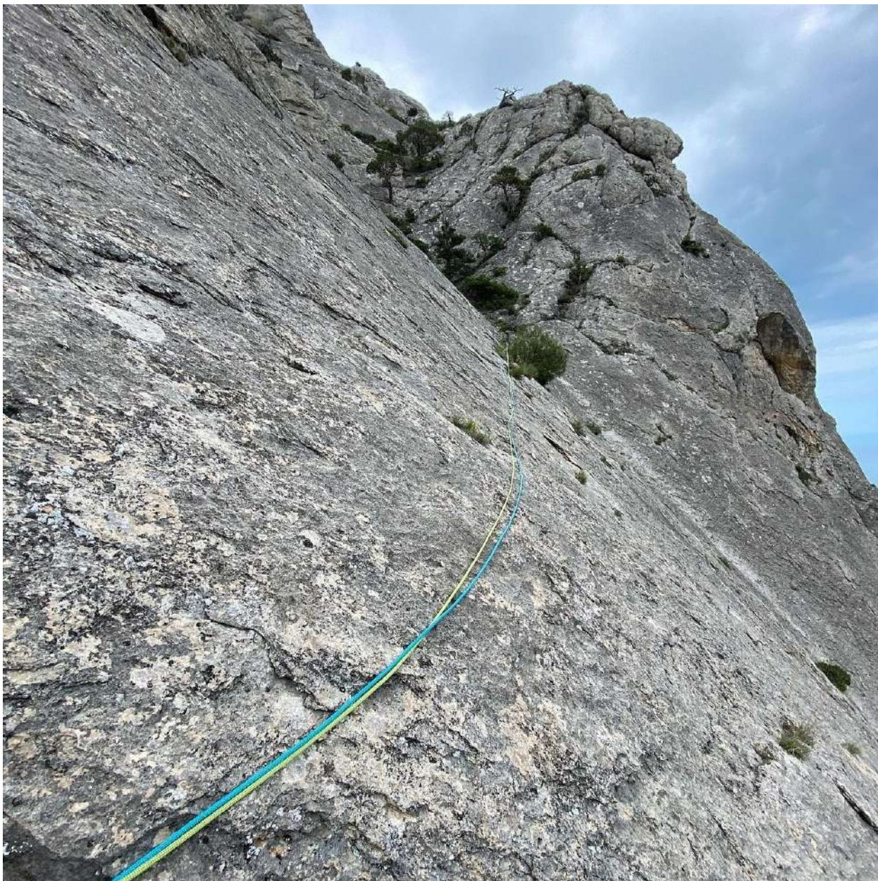
Фото 6. Участок R2-R3