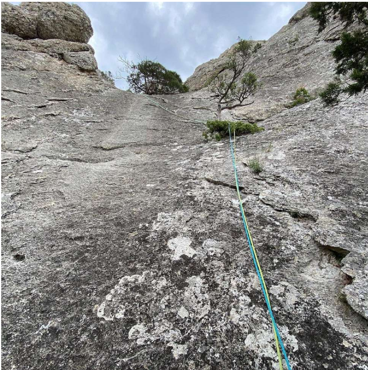
Фото 8 . Участок R4-R5