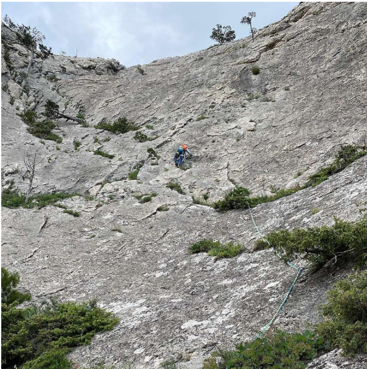
Фото 9. Участок R7-R8