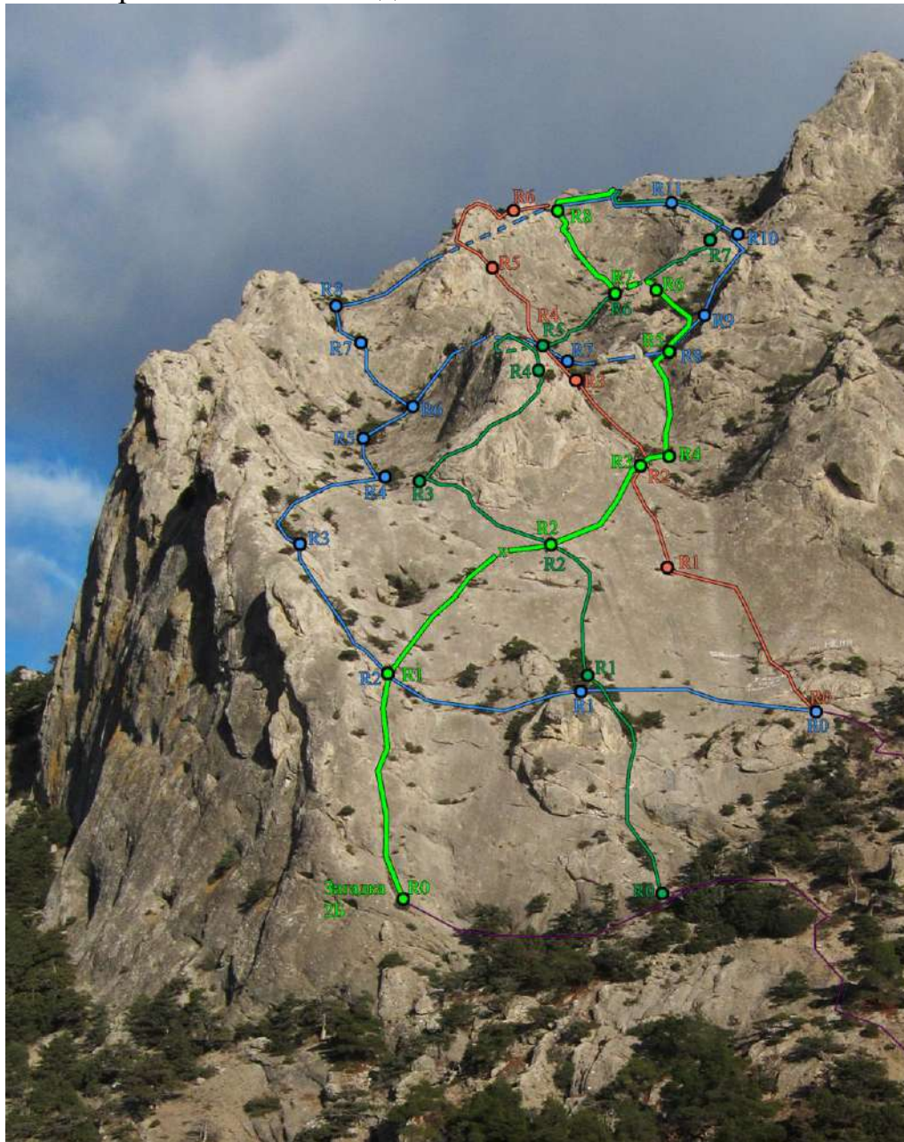
Фото 3. Техническая фотография маршрута.

2.1. Техническая фотография маршрута , фото снято со скального выступа, на 400 м. правее начала Западной стены Сокола – см. Фото 2