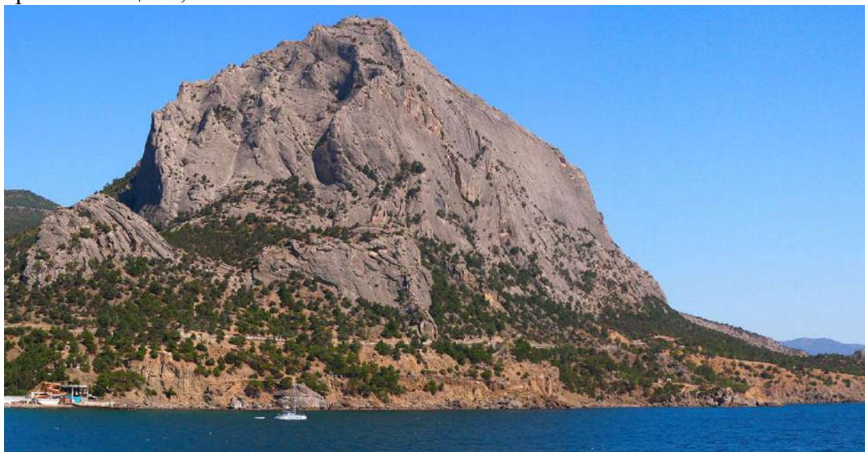
Фото1. Гора Сокол

1.1. Общее фото вершины – см. Фото 1 – снято 01.07.2020 г. Место съемки – тропа Галицина, Новый Свет.