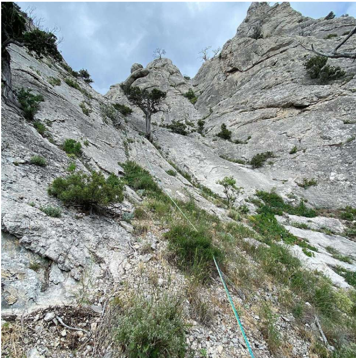
Фото 7 . Участок R3-R4