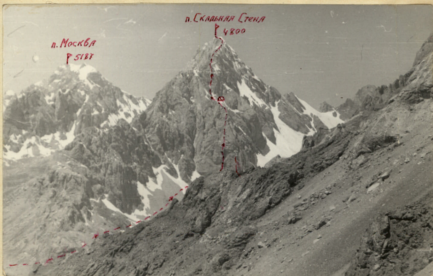
Вид на п. Скальная Стена с пер. Казнок.