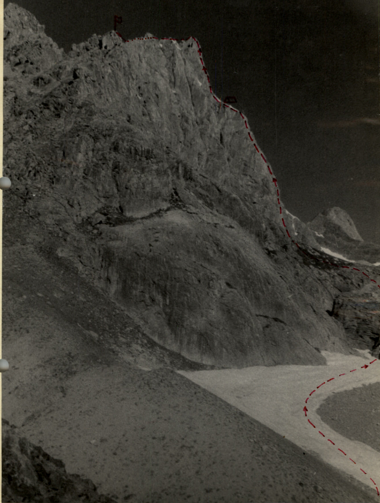
Профиль стены. Вид из штурмового лагеря. С КИЛЬБЕД СТЕНА