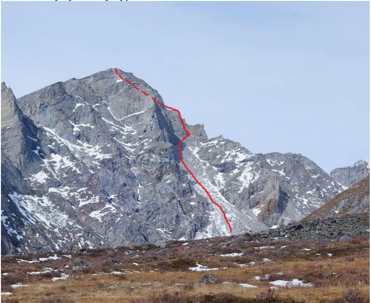
Фото 2. Линия маршрута.