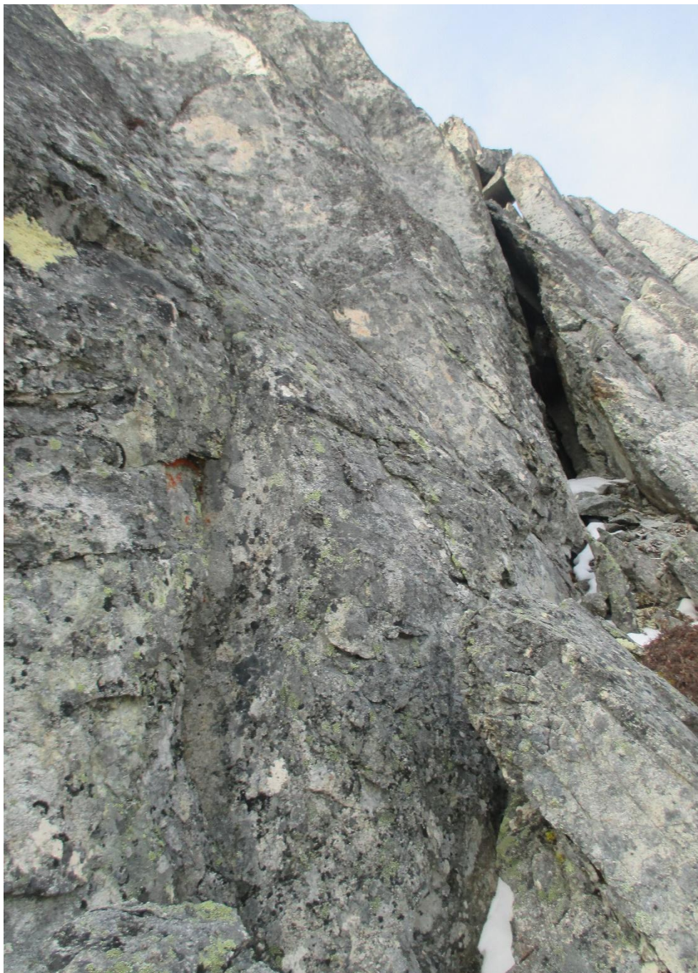
Фото 7, начало участка 1-2, фото со станции. Забираем вверх и влево.