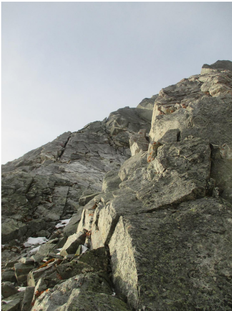
Фото 5. Начало маршрута, участок 0-1, внутренний угол, правее в верхней части фотографии видит серый карниз из блока. Хорошо видны множественные щели. Страховку очень удобно организовывать закладными элементами.