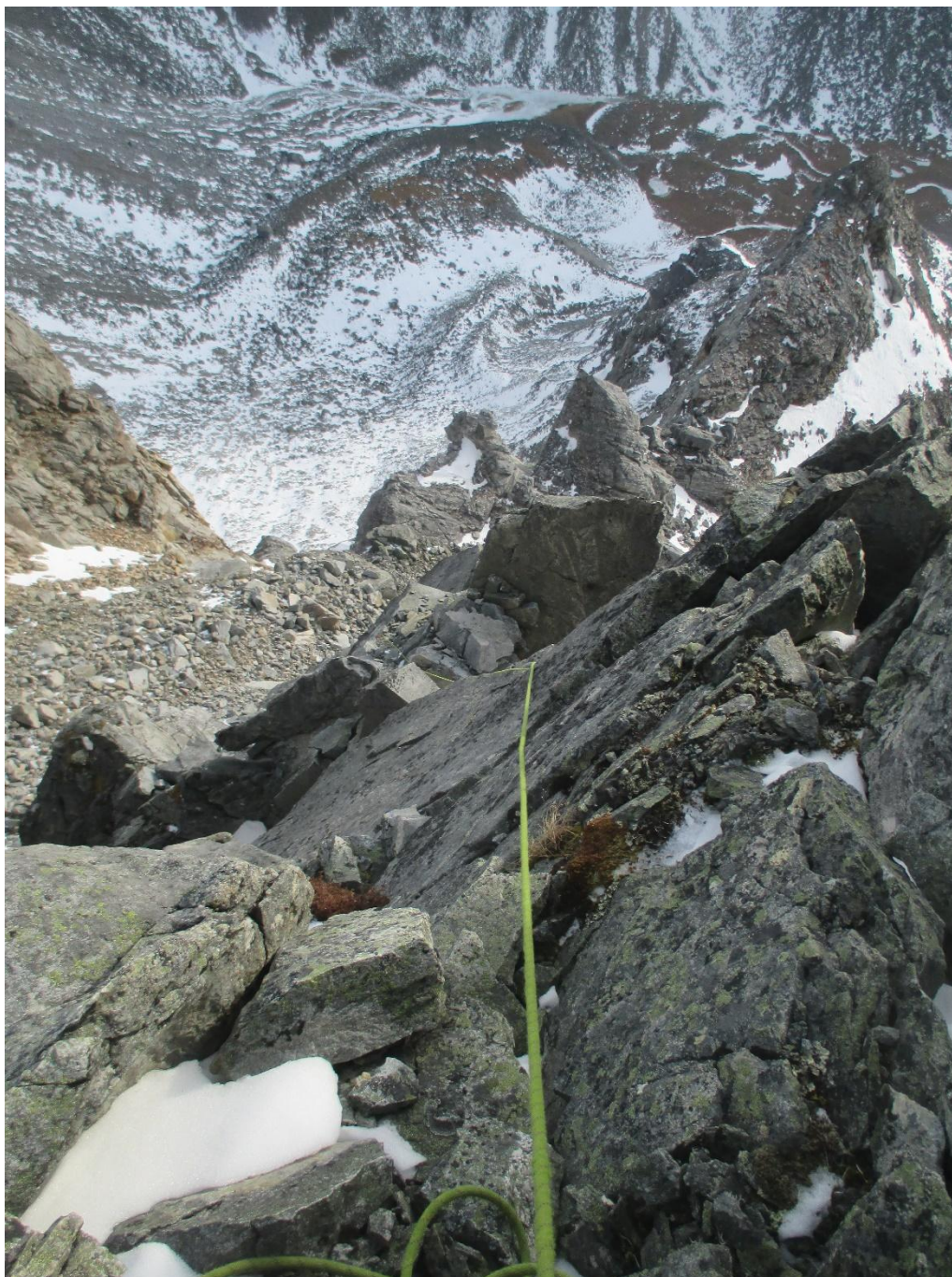
Фото 6, вид на участок 0-1 со станции.