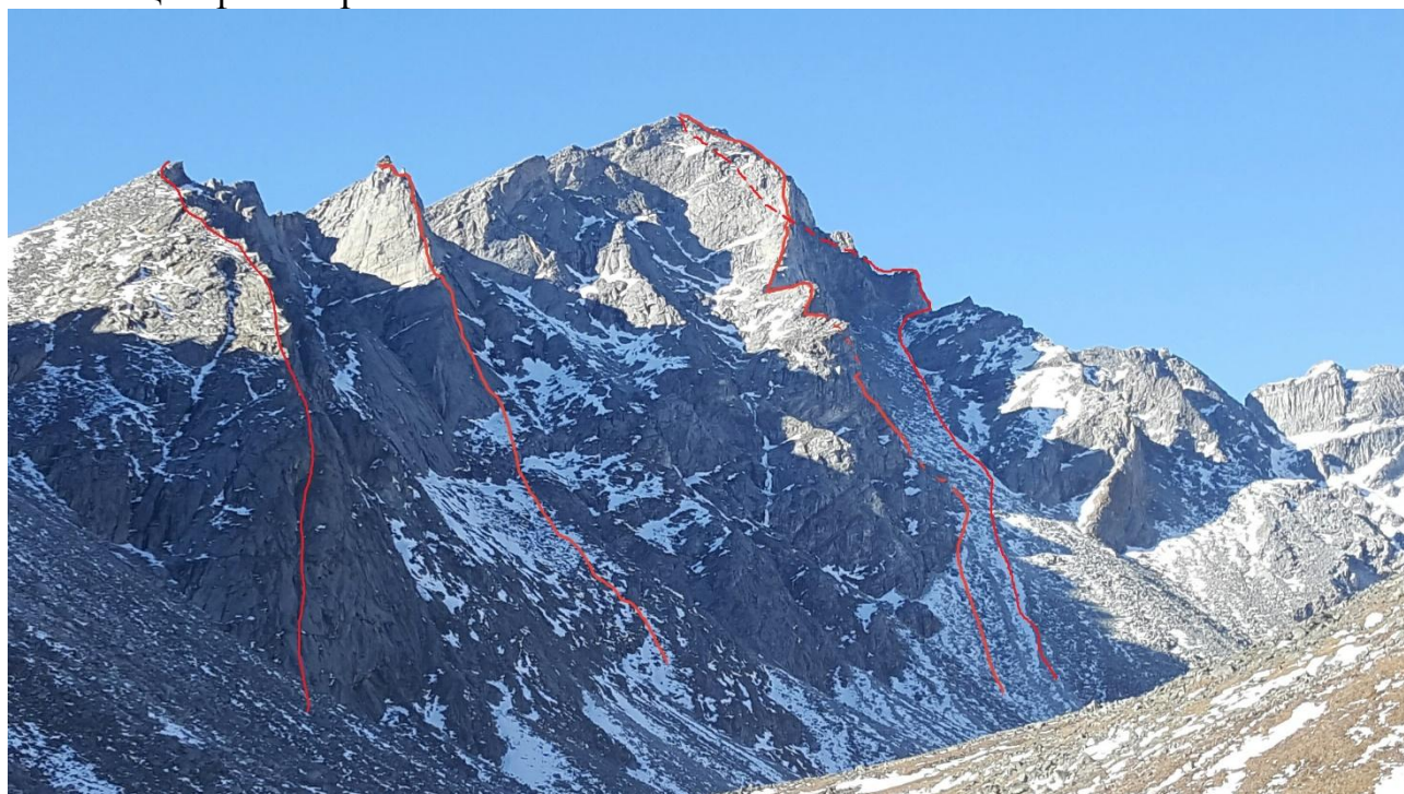
Фото 1. Фото сделано 14.10.2018 из ущелья Чертылым-Горхон Маршруты слева направо: ЮВ кф. Югр. 4А, Зуб Обманчивой 5А, В кф. С гр. 4Б.