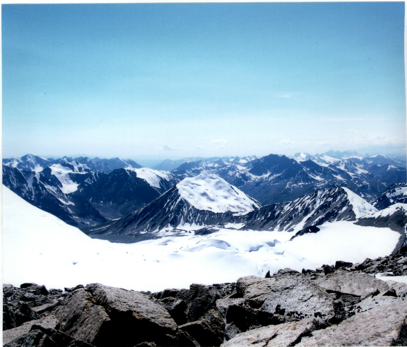
фото 7. Вид на юг в сторону монгольского Алтая.