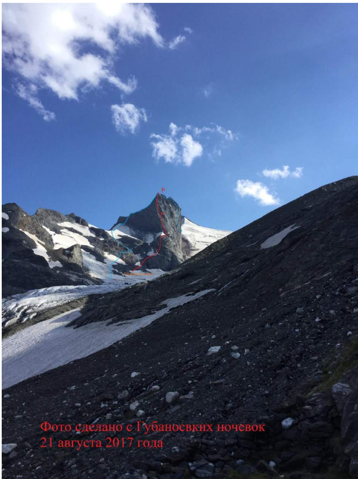
Фото сделано с Губаносвских ночёвок 21 августа 2017 года