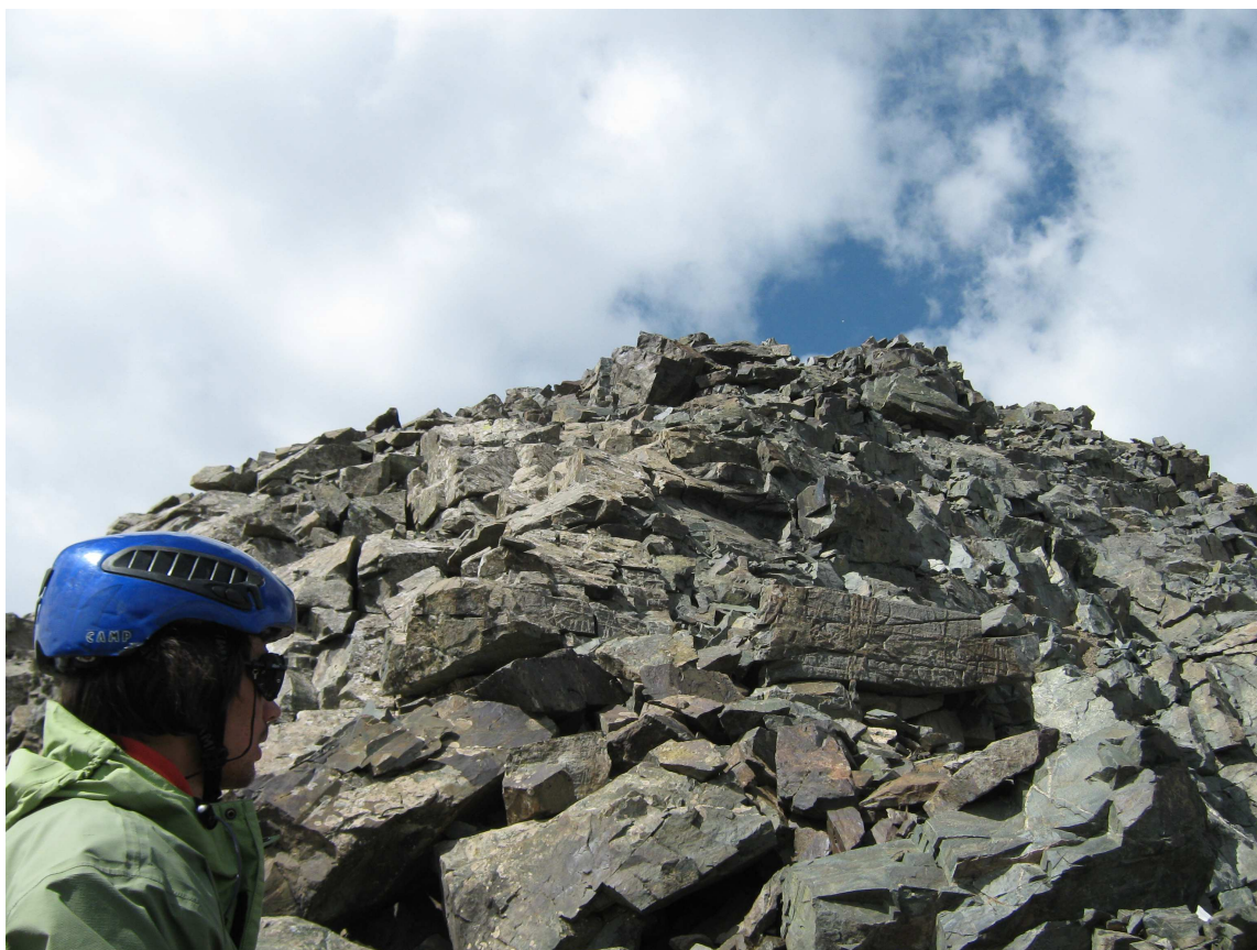
Фото6 Пик Дементьева из ущелья Телеты