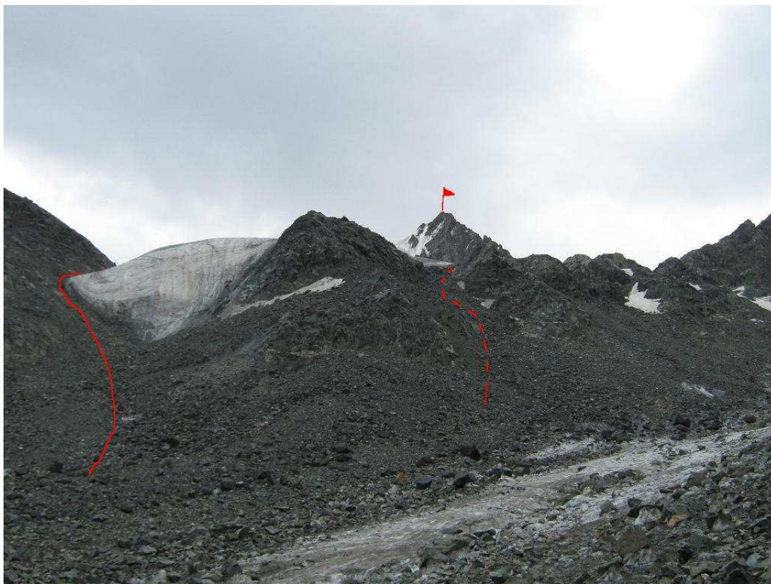
Фото2 Участок R0-R1