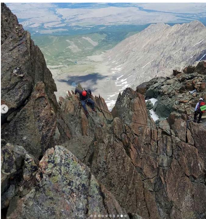
Вид с вершины на работу группы