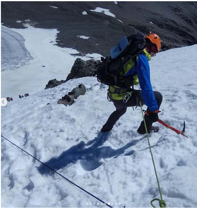
Подъем по сн-лед. склону