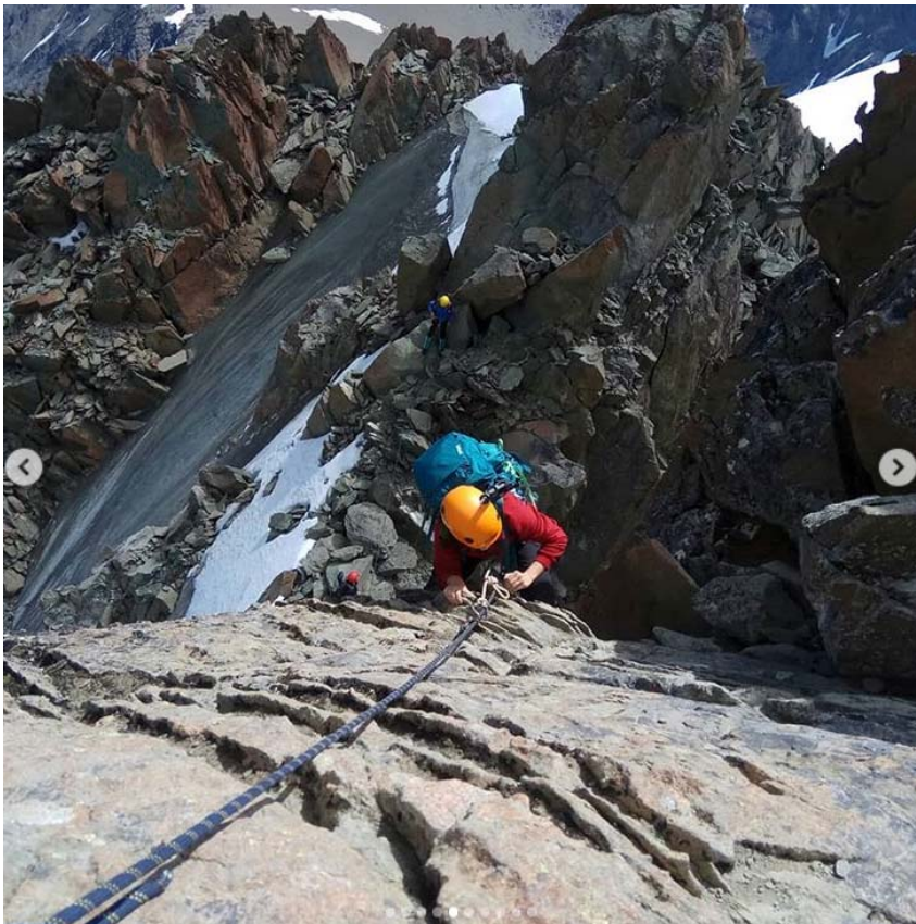
Ключевая стенка, 5 м