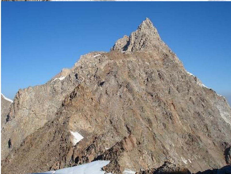
ВОСТОЧНЫЙ гребень на тютю главную